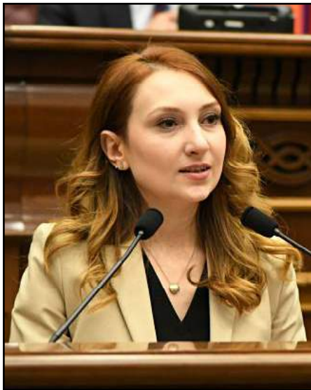
«Իմ Քայլը» խմբակցութեան ղեկավար Լիլիթ Մակունց

Ազգային ժողովին, «Իմ Քայլը» խմբակցութեան ղեկավար՝ Լիլիթ Մակունցը խորհրդարանէն ներս ունեցած ելոյթի ժամանակ յայտնեց, որ Մայիս 8-ին խորհրդարանին մէջ տեղի ունեցած միջադէպը պէտք է ունենայ քաղաքական հետեւանք: Մակունցի խօսքով, Սասուն Միքայէլեան վար կը դնէ մանդատը կը հրաժարի իր իրաւագիրէն, եթէ վար դնէ եւ հրաժարի Լուսաւոր Հայաստան խմբակցութեան ղեկավար՝ Էտմոն Մարուքեան: