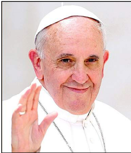
Հռոմի Ֆրանչիսկոս Պապ

Նորին Սրբութիւնը շնորհաւորած է Նիկոլ Փաշինեանը՝ Հա-