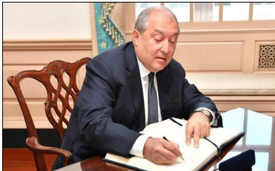
Նախագահ Արմէն Սարգսեան կը ստորագրէ Ազգային ժողովի օրէնքներէն մէկը

Հայաստանի նախագահ Արմէն Սարգսեան Մայիս 11-ին ստորագրած է «Ապօրինի գոյքի բռնագանձման մասին» օրէնքը եւ 14 յարակից օրէնքները, կը յայտնեն նախագահի աշխատակազմէն: Օրէնքները Ազգային ժողովի կողմէն նախագահի ստորագրման ներկայացուած էին Ապրիլ 21-ին: