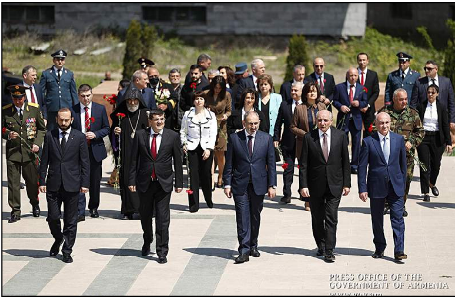
Հայաստանի Եւ Արցախի ղեկավարները կը մասնակցին եռատօնի միջոցառումներուն

Մայիս 9-ին, Հայաստանի Եւ Արցախի մէջ նշուեցաւ Մայիսեան Եռատօնը՝ Հայրենական մեծ պատերազմի յաղթանակի, Շուշիի ազատագրման Եւ Արցախի Պաշտպանութեան Բանակի կազմութեան օրերը: