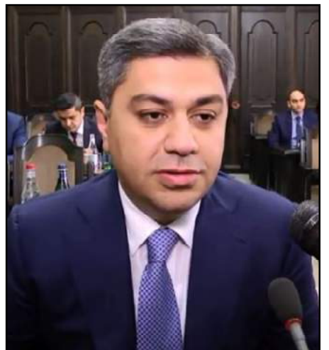
ԱԱԾ նախկին տնօրէն՝ Արթուր Վանեցեան

նախկին դեսպան՝ Միքայէլ Մինասեան յայտարարած էր, որ վարչապետ Նիկոլ Փաշինեան Ազգային Անվտանգութեան Ծառայութեան նախկին տնօրէն Արթուր Վանեցեանի միջոցով իրեն գործարք առաջարկած է, որ իր դէմ քրէական հետապնդումը կը դադրի, եթէ վերջինը համաձայնի խորհրդանշական գումար փոխանցել ինչ, որ հիմնադրամի եւ քաղաքականութեամբ չզբաղի: Միքայէլ Մինասեանի համաձայն՝ ինք այդ գործարքի առաջարկը մերժած է: