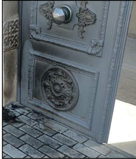
Պոլսոյ Ս. Աստուածածնի եկեղեցւոյ դուռը, ուր կ'երեւի վառելու փորձի հետքերը

նութիւններու կրօնական հաստատութիւններու հանդէպ ատելութեան հողի վրայ կատարուող յարձակումներուն վրայ ազդեցութիւն ունին Թուրքիոյ նախագահի կողմէ գործածուող խօսքերը, ինչպէս օրինակ՝ «Սուրի աւելցուկ» արտայայտութիւնը: