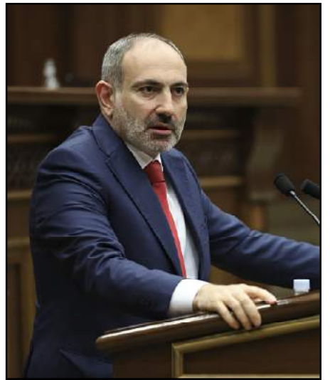
Վարչապետ Նիկոլ Փաշինեան

«Դիտելով այսօր տեղի ունեցած միջադէպի տեսագրութիւնը, մի պարզ հարց եմ տալիս՝ իսկ ի՞նչ գործ ունէր ելոյթ ունեցող այնտեղ կանգնած եւ երբ որ ամպլիննից