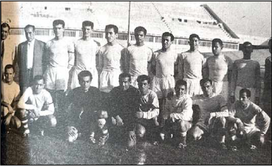
1961-1962 խաղաշրջանին, Լիբանանի ախոյեան Հ.Մ.Մ.ը