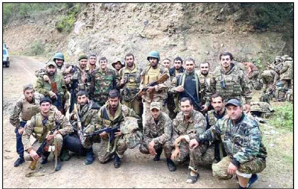
Արցախի Հանրապետութեան նախագահ Արայիկ Յարութիւնեան՝ ռազմաճակատի վրայ Հայ զինուորներուն հետ

Միւս կողմէ նախագահ Արմէն Սարգսեան եւ վարչապետ Փաշին- եան հարցազրոյցներով հանդէս կու