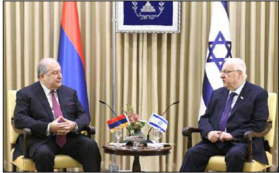
Հայաստանի նախագահ Արմէն Սարգսեան եւ Իսրայէլի նախագահ Ռուվեն Ռիվլինի - արխիւ

Հայաստանի Հանրապետութեան նախագահ: Արմէն Սարգսեան հեռախօսազրոյց ունեցած է Իսրայէլի Պետութեան նախագահ Ռուվեն Ռիվլինի հետ: Այս մասին յայտնեցին ՀՀ նախագահի աշխատակազմի հասարակութեան հետ կապերու վարչութեանէն: Զրոյցի սկիզբը, նախագահները անդրադարձած են երկկողմանի յարաբերութիւններուն առնչուող հարցերուն: Նախագահ: Սարգսեան այնուհետեւ ներկայացուցած է Արցախի ու Հայաստանի սահմաններուն Ատրպէյճանի սանձազերծած ռազմական յարձակումի հետեւանքով ստեղծուած իրադրութիւնը: Նախագահ Սարգսեան նշած է, որ Իսրայէլի կողմէ Ատրպէյճանին վաճառուող զէնք-զինամթերքը իրականութեան մէջ ոչ միայն պաշտպանական նպատակներով կ'օգտագործուի, ինչպէս նախապէս կը հաւաստիացնէր Իսրայէլական կողմը, այլեւ՝ յարձակողական: Այդ զինատեսակները լայնօրէն կը կիրառուին հայկական բնակավայրերը հրետակոծելու նպատակով եւ քաղաքացիական խաղաղ բնակչութեան դէմ՝ յանգեցնելով մարդկային բազմաթիւ զոհերու ու հակապական աւերածութիւններու: Նախագահ Սարգսեան բոլոր շափանիչներով անընդունելի համարած է զէնքի շարունակական մատակարարումը: Ընդգծելով, որ այն լրջօրէն կարող է վտանգել Հայաստանի յարաբերութիւնները: Ան յորդորած է Իսրայէլի նախագահը, օգտագործել ազդեցութիւնը իր երկրի կառավարութեան վրայ: անյապաղ դադարեցնելու զէնքի մատակարարումները Ատրպէյճանին: Նախագահ Արմէն Սարգսեան տեղեկացուցած է, որ հայկական կողմի մտահոգութիւններն ու դիտարկումները արտացոլուած է նաեւ նախագահ Ռիվլինին ուղղուած նամակին մէջ: Նախագահ Ռիվլինը պատրաստակամութիւն յայտնած է իր երկրի կառավարութեան հետ ամենայն ուշադրութեամբ ուսումնասիրել հայկական կողմի բարձրացուցած հարցերը: