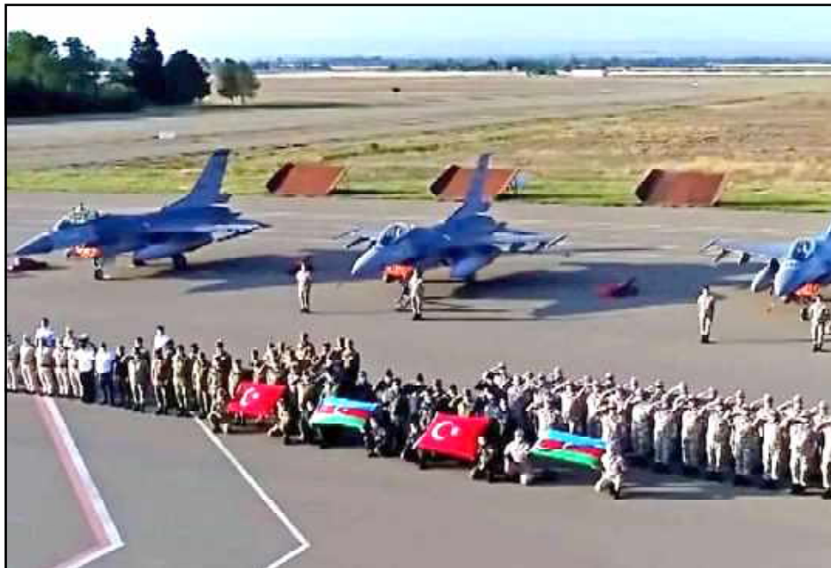
Գյանջայի ռազմական օդակայանը հրթիռակոծումէն առաջ

Արցախի Նախագահ Արայիկ Յարութիւնեանի հրամանով այսօր Պաշտպանութեան Բանակը ատրպէյճանական Գյանջայ քաղաքին մէջ տեղակայուած ռազմական կէտերու վնասագրծման նպատակով հասցուցած է մի քանի հրթիռային հարուած: Այս տեղեկութիւնը փոխանցելով Յարութիւնեան աւելցուցած է՝ «Այս պահի դրութեամբ յանձնարարել եմ դադարեցնել կրակը: Քաղաքացիական բնակչութեան շրջանում անմեղ զոհերից խուսափելու համար: Թշնամու կողմից համապատասխան հետեւութիւններ չանելու պարագայում մենք շարունակելու ենք համազօր ու հուժկու հարուածները: կազմալուծելով եւ կազմաքանդելով թշնամու բանակը եւ թիկունքը: Մենք մինչեւ վերջ վճռական ենք մեր գործողութիւններում: Կանգ առէք, քանի դեռ ուշ չէ»: Աւելի կանուխ Արցախի նախագահը յայտնած էր, որ ատրպէյճանական բանակը, օգտագործելով «Պոլոնեզ» եւ «Սմերչ» համակարգեր, թիրախ կը դարձնէ Ստեփանակերտի խաղաղ բնակչութիւնը: Միեւնոյն ժամանակ Արայիկ Յարութիւնեան զգուշացուցած էր, որ Ատրպէյճանի զինուորական կէտերը յայտնաբերելու կը դառնան Պաշտպանութեան Բանակի թիրախները: Աւելի ուշ նախագահի խօսնակ Վահրամ Պօղոսեանը յայտարարուեց. «Գյանջայի ռազմական օդանակայանը յօդու յնդեց»: