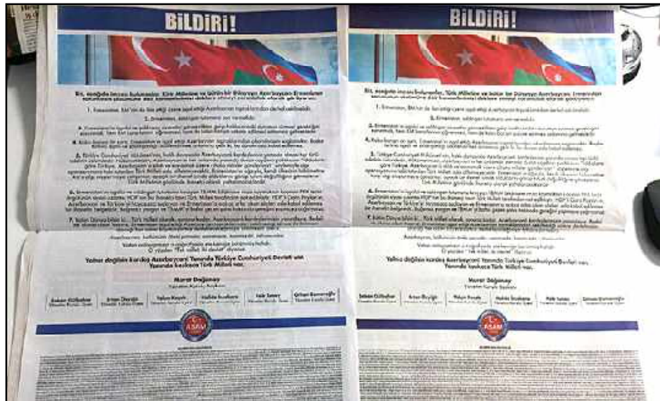
ԱՍԱՄ-ի ստորագրութեամբ հրապարակուած ծանուցումը

զիտեմ, թէ ինչ կը նշանակէ այս յայտարարութիւնը: Հակառակ այս իրողութեան, պիտի չնահանջեմ պատասխանատուութիւն ստանձնել՝ պատերազմները կանխելու համար: Անձիս դէմ հաւանական բոլոր յարձակումներուն պատասխանատուն, իշխանութիւններուն չափ, ԱՍԱՄ եւ նման կազմակեր-