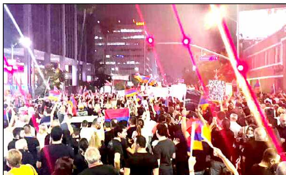
Հայ ցուցարարները հաւաքուած CNN-ի շէնքին առջեւ

Արցախի դէմ շղթայագերծ- ուած Ատրպեյճանա-թրքական յար- ձակումին ու պատերազմական գոր- ծողութիւններու առաջին վայրկ- եաններէն սկսեալ Լոս Անճելըսի Հայութիւնը ենթարկուեցաւ զօրա- շարժի: