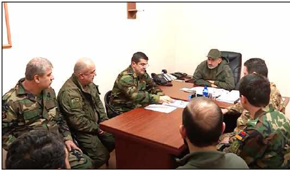
Հայաստանի վարչապետը եւ Արցախի նախագահը խորհրդակցութեան ընթացքին

Վարչապետ Նիկոլ Փաշինեան Հոկտեմբեր 5-ին այցելած է Արցախ: Վարչապետի աշխատակազմի տեղեկատուութեան եւ հասարակութեան հետ կապերու վարչութեան հաղորդմամբ՝ Փաշինեան Արցախի նախագահ՝ Արայիկ Յարութիւնեանի եւ Զինուած ուժերու բարձրագոյն սպայակազմի հետ կապուեցած է խորհրդակցութիւն: Արցախի պաշտպանութեան