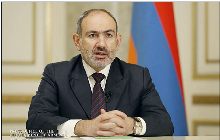
Հայաստանի վարչապետ Նիկոլ Փաշինեան

Նիկոլ Փաշինեան մտահոգութիւն չայտնեց թէ՛ Հայաստանի սահմաններու, թէ՛ իր հրաժարականի վերաբերեալ տեղեկատու-