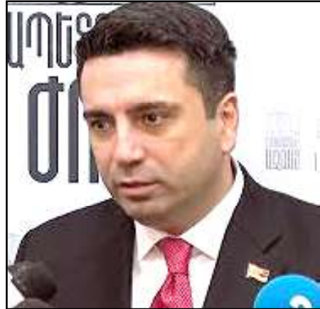
Աժ փոխնախագահ Ալեն Սիմոնեան

թիւններու անդամներն ալ թիկնապահներով կը շրջին: «Պարոն Վանեցեանը 6 թիկնապահով է հանրահաւաքին գալիս, ինչո՞ւ իրենից չէք հարցնում: Մենք խօսում ենք փաստացի երկրի ղեկավարի մասին, որը պատերազմական դրութեան մէջ է գտնուում», - աւելցուց Սիմոնեան: