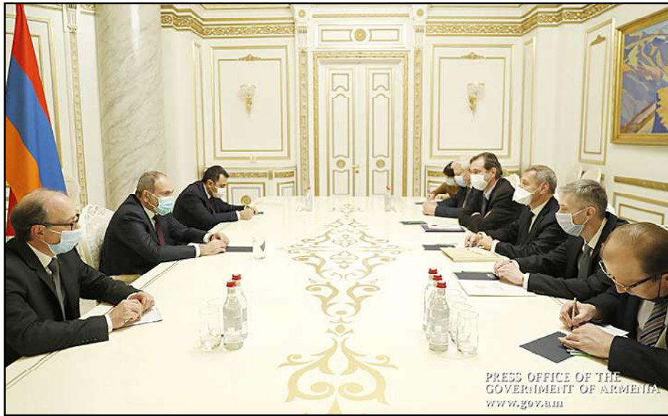
ԵԱՀԿ Մինսքի խումբի համանախագահներու հանդիպումը Պալատային վարչապետին հետ

Հայաստան անհրաժեշտ կը համարէ ԵԱՀԿ Մինսքի խումբի համանախագահութեան ձեռագրուած զարաբաղեան բանակցութիւններու վերականգնումը, հիմնախնդրի համապարփակ կարգաւորման նպատակով, Դեկտեմբեր 14-ին, Երեւանի մէջ ընդունելով համանախագահները, յայտարարած է վարչապետ Նիկոլ Փաշինեան: