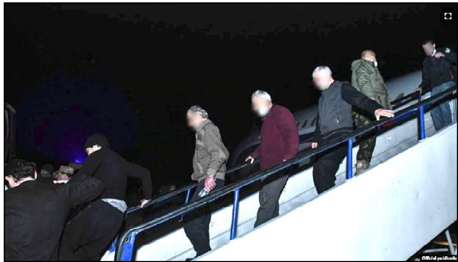
Հայ գերիները կը վերադառնան Երեւան

Երկուշաբթի, Դեկտեմբեր 14-ի ուշ երեկոյեան Երեւան Ժամանեցին Ատրպէյճան գերեզարուած 44 հայ գերիներ: «Էրեբունի» օդակայանին մէջ Արցախի նախագահ՝ Արայիկ ԅարութիւնեանի եւ Հայաստանի փոխվարչապետ՝ Տիգրան Աւինեանի հետ զիրենք կը դիմաւորէին նաեւ հարազատները: Անոնք սրտատրոփ կը սպասէին, որ պիտի լսեն իրենց որդիներու, հայրերու եւ ամուսիններու անունները: Հաւաքուածներու միակ ցանկութիւնն էր՝ օր, ժամ, րոպէ առաջ իրենց հարազատները հասնին տուն: