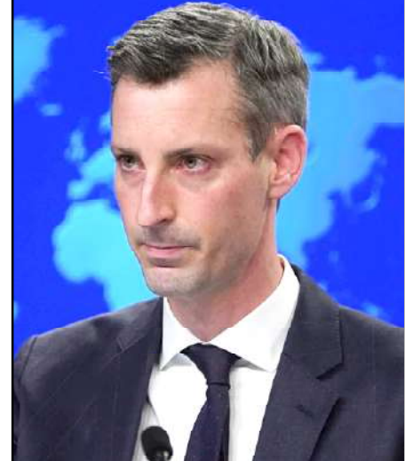
ԱՄՆ-ի Պետական Բաժանմունքի խօսնակ՝ Նետ Փրայս

Պետական Բաժանմունքի խօսնակը հարցը դիտարկած է միայն յեղաշրջման եւ ոչ թէ յեղաշրջման փորձի համաթեքսթով ու պնդած, թէ Հայաստանի մէջ տեղի ունեցողը չի համապատասխանը coup