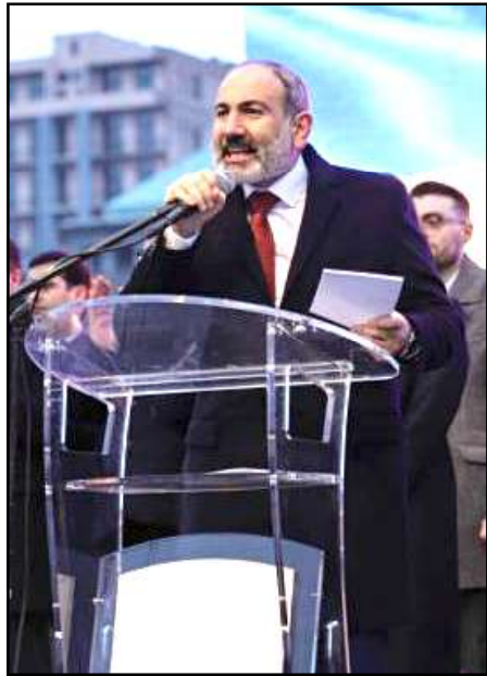
Վարչապետ Նիկոլ Փաշինեան հանրահաւաքի ընթացքին

Վարչապետ Նիկոլ Փաշինեան Մարտ 1-ին, Հանրապետութեան հրապարակին վրայ հաւաքուած տասնեակ հազարաւորներու ներկայութեան անդրադարձաւ երկիրը յուզող շարք մը թեմաներու: Նախ ան յայտարարեց, որ կը մնայ իր կարծիքին, թէ Զինուած Ուժերու Գլխաւոր Շտաբի պետ՝ Օնիկ Գասպարեանը պէտք է լքէ այդ պաշտօնը: Աւելին ըսաւ, որ Գասպարեան, վարչապետի ու կառավարութեան հրաժարականը պահանջող յայտարարութիւնը ստորագրած է երրորդ նախագահ՝ Սեթ Սարգսեանի դրդմամբ: