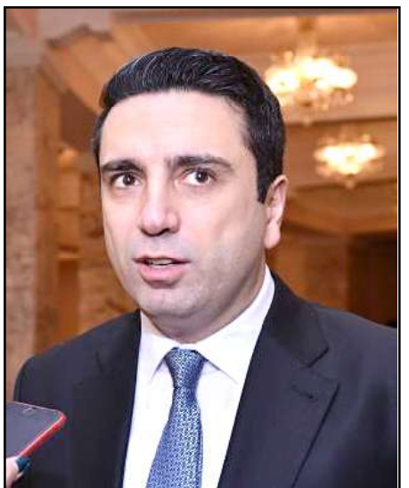
ՀՀ ազգային ժողովի փոխնախագահ՝ Ալեն Սիմոնեան

Նիկոլ Փաշինեան հեռակաջ բանավէճը սկսած է Զինուած ուժերու գլխաւոր շտաբի պետ՝ Օննիկ Գասպարեանը պաշտօնէն ազատելու՝ վարչապետ Նիկոլ Փաշինեանի որոշումէն յետոյ: Օննիկ Գասպարեանը պաշտօնէն ազատելու առաջարկութիւնը վարչապետը նախագահին ներկայացուցած է Փետրուար 25-ին, երբ առաւօտեան հրապարակուեցաւ Զինուած ուժերու անունով ԳՇ յայտարարութիւնը՝ վարչապետի եւ կառավարութեան հրաժարականի պահանջով: Վարչապետը այդ յայտարարութիւնը «նազմական լեղաշըջման փորձ» որակեց: Նոյն օրը կայացած հանրահաւաքին Փաշինեան նաեւ հրաժարական տալու կոչ ըրաւ Գասպարեանին: Հայաստանի Հանրապետութեան նախագահը Փետրուար 27-ին Գասպարեանը պաշտօնանկ ընելու հրամանագրի նախագիծը առարկութիւններով ետ ուղարկեց վարչապետի աշխատակազմ: Վարչապետն ալ միջնորդութիւնը կրկին ուղարկեց նախագահին՝ նշելով, որ «այս որոշումը ամենեւին չի նպաստում ստեղծուած իրավիճակի հանգուցալուծմանը»: