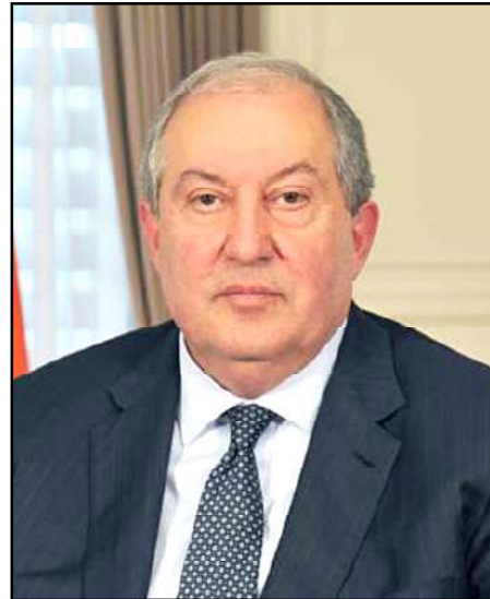
Նախագահ Արմէն Սարգսեան

Երկրի ղեկավարը նաեւ հրապարակայնօրէն խոստացաւ երթալ արտահերթ ընտրութիւններու առաջնահերթ խորհրդարանական խմբակցութիւններու համաձայնութեան պարագային, ինչպէս նաեւ