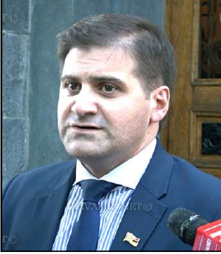
ԱԺ պատգամաւոր Արման Բաբաջանեան

«Որովհետեւ հիմա, յատկապէս այս օրերին տեղի ունեցող լոյսի ներքոյ 13 տարի առաջ տեղի ունեցածը բոլորովին այլ իմաստ ու նշանակութիւն է ստանում այն իմաստով, որ 13 տարի առաջ էլ թիրախն իրականում առանձին ցուցարարները չէին, որոնք սպանուողներին փաստացի պատերազմի մէջ գտնուող երկրի բանակի ներքաւումամբ: Թիրախը 13 տարի եւս ՀՀ քաղաքացին էր, ՀՀ ժողովուրդն էր, ՀՀ ժողովուրդի իշխանութիւնն էր: 13 տարի առաջ գրեթէ նոյն ուժերը, որոնք այսօր պատերազմ