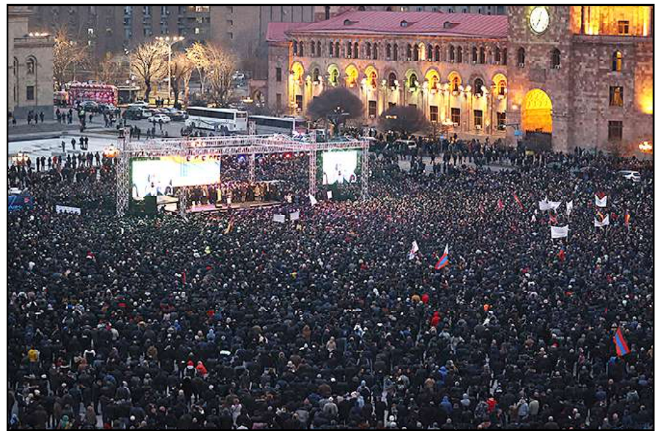
Հանրապետութեան հրապարակին վրայ հաւաքուած ժողովուրդը

Մարտ 2-ին Նախագահ Արմէն Սարգսեան յայտարարեց, որ չ'ընդունիր Զինուած Ուժերու գլխաւոր շտաբի պետ Օնիկ Գասպարեանը պաշտօնէն ազատելու՝ վարչապետ Նիկոլ Փաշինեանի առաջարկութիւնը եւ Սահմանադրական դատարան (ՄԴ) դիմած է մէկ այլ՝ «Զինուորական ծառայութեան եւ զինծառայողի կարգավիճակի մասին» օրէնքի առնչութեամբ: Նախագահը յիշեցուցած է, որ իր նախորդ յայտարարութիւններուն մէջ ընդգծած էր, որ խնդրի շուտափոյթ եւ Սահմանադրութեան ծիրէն ներս կարգաւորուած Հայաստանի եւ Արցախի անվտանգութեան ու կայունութեան համար առաջնային կարեւորութիւն ունի եւ բացարձակ անհրաժեշտութիւն է պետականութեան պահպանման, հասարակութեան հետազոյց պառակտումը կանխելու, ժողովուրդի միասնութիւնը եւ հանրային համերաշխութիւնը վերականգնելու, ստեղծուած անորոշ վիճակէն դուրս գալու եւ վերջնական հանգուցալուծման հասնելու հա-