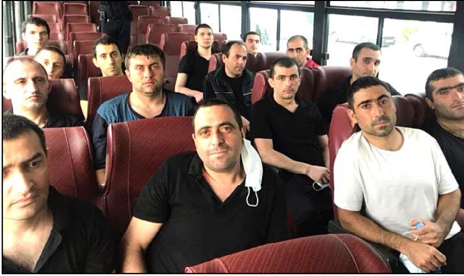
Ռազմագերիները ազատ արձակուելէ ետք կը վերադառնան Հայրենիք

Մի քանի օր առաջ 15 հայ ռազմագերիներ վերադարձան Հայրենիք: