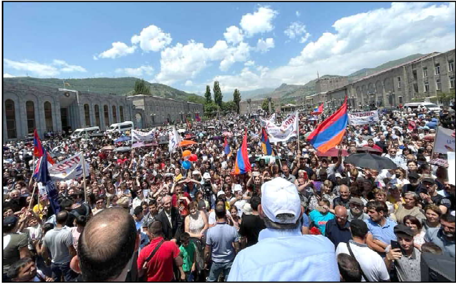
Սիւնի Փաշինեանի Հանրահաւաքը

Հակառակ մասնակիցներու մեծ թիւին, գլխաւոր պայքարը կ'ընթանայ վարչապետ Նիկոլ Փաշինեանի եւ երկրի նախկին բռնապետ Ռոպերթ Քոչարեանի միջեւ: Քոչարեանի հանրահաւաքները նուազ բազմամարդ են ու գլխաւորաբար մասնակցութիւն կ'ապահովեն խոշոր գործարարները, որոնք