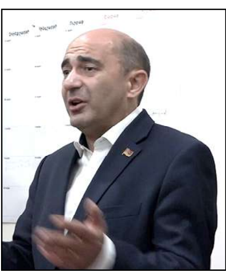
«Լուսաւոր Հայաստան» կուսակցութեան առաջնորդ Էտմոն Մարուքեան

«Որ ուժը՝ 51 տոկոս հաւաքեց, միւս ուժն ասելու է՝ «կեղծուել էն ընտրութիւնները», ժողովրդին հանելու ա, բերի հրապարակ, ցնցումներ են սկսելու երկրի ներսում, թուրքերն էլ, ժամացոյցին նայելով, սպասում են, տեսնեն դա երբ ա լինելու», - յայտարարեց «Լուսաւոր Հայաստան» կուսակցութեան առաջնորդ Էտմոն Մարուքեան՝ այդուհանդերձ վստահութիւն յայտնելով, որ որեւէ ուժ պիտի չկարողանայ հաւաքել 50 տոկոսէն աւելի ձայն: