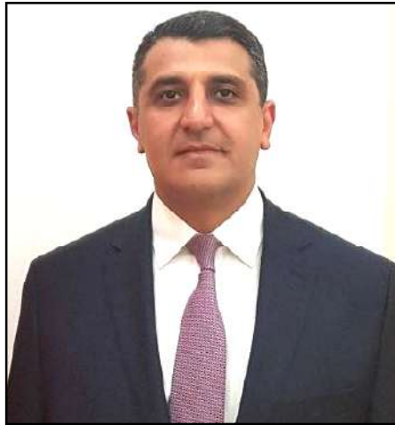
Դեսպան Վարուժան Ներսէսեան

Այսօրուայ մէկ այլ հրամանագիրով, որ նոյնպէս հրապարակուած է Հայաստանի նախագահի պաշտօնական կայքէջը, Զիւնիկ Աղաճանեան ետ կանչուած է Ինտոնեզիոյ, Մալայզիոյ եւ Սինկաբորի մօտ Հայաստանի դեսպանի պաշտօնէն: