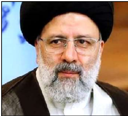
Իրանի Հանրապետութեան նորընտիր նախագահ՝ Մէջէտ Իպրահիմ Ռայիսի

Ընդհանուր մարտահրաւէրները անխուսափելի դարձուցած են երկու երկիրներու փոխգործակցութեան խորացումը՝ յանուն տարածաշրջանի խաղաղութեան ապահովման եւ կայունութեան պահանջները: