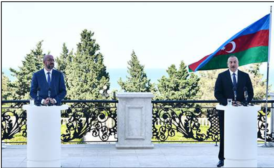
Շառլ Միշել եւ Իլհամ Ալիեւ Պաքուի մէջ կայացած հանդիպումի ընթացքին

«Կայունութիւնը եւ անվտանգութիւնը տարածաշրջանին մէջ կը դառնան արդէն իրականութիւն», յայտարարած է Ատրպէյճանի նախագահը: