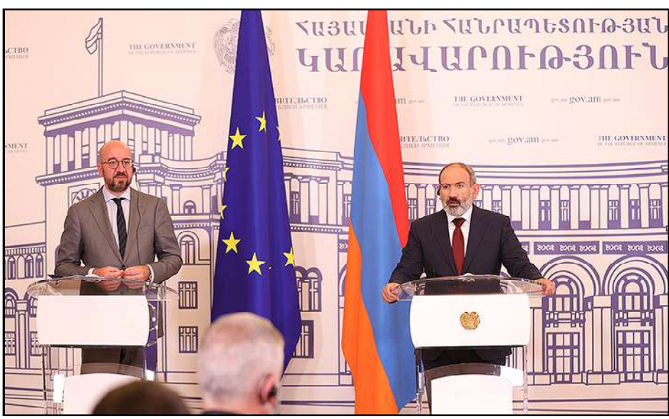
Շառլ Միշլէլ եւ Նիկոլ Փաշինեան միատեղ մամլոյ ասուլիսի ընթացքին

«Հայաստանը պատրաստ է բանակցութիւնների վերսկսմանը,