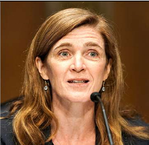
Քննարկական Պրատ Շերմընն եւ դեսպան՝ Սամանթա Փաուլըր

ԱՄՆ-ի քոնկրէսական Պրատ Շերմընն ԱՄՆ-ի Միջազգային գործազման գործակալութեան (USAID) տնօրէն, դեսպան՝ Սամանթա Փաուլըրին հարց ուղղաքոնկրէսական Պրատ Շերմընն է, ցանկալով տեղեկանալ, արդեօ՞ք Միացեալ Նահանգներու վարչակազմը մտադիւր է Ատրպէյճանի պատերազմական յանցագործութիւններու ու յարձակումի հետեւանքով Արցախին տեղահանուած աւելի քան 100 հազար հայերուն օգնելու նպատակով 5 միլիոն տոլար գումարէն բացի օգնութիւն տրամադրել: