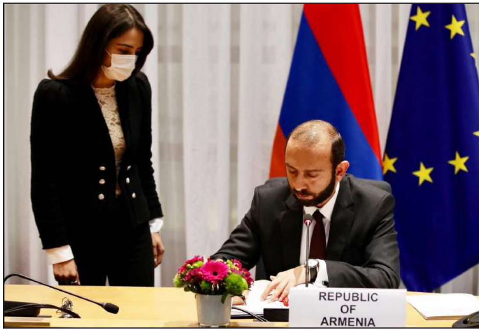
Արարատ Միրզոյեանը ԵՄ պաշտօնեաներուն հետ մէջ կ'ստորագրէ Հայաստան-Եւրոպական միութիւն օդագնացութեան համաձայնագիրը

Արտաքին գործոց նախարար՝ Արարատ Միրզոյեանը ԵՄ պաշտօնեաներուն հետ Պրիւքսէլի մէջ ստորագրած է Հայաստան-Եւրոպական միութիւն ընդհանուր օդագնացութեան համաձայնագիրը: «Մօտ ապագայում համաձայնագրի վաւերացումն ու ուժի մէջ մտնելը նոր հնարաւորութիւններ կը ստեղծի Հայաստանում օդագնացութեան ոլորտի զարգացման համար՝ դիւրացնելով Հայաստանի քաղաքացիներին կապը եւրոպական այլ երկրներին հետ», - յայտարարած է Արարատ Միրզոյեանը, հարգած է ԱԳՆ-ն: