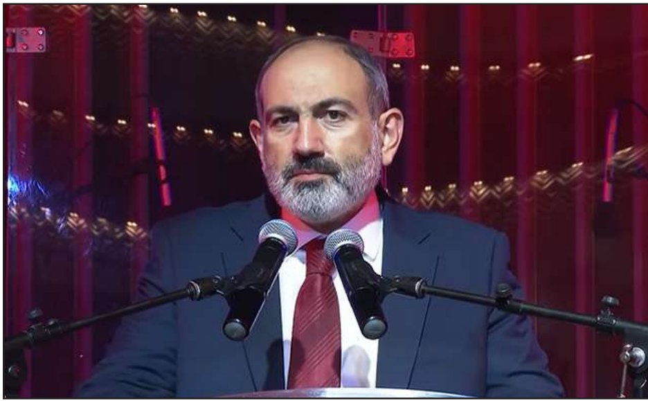
Վարչապետ Փաշինեանը ելոյթ կ'ունենայ «Քաղաքացիական պայմանագիր» կուսակցութեան դրամահաւաք ժամանակ

ՀՀ վարչապետ Նիկոլ Փաշինեանը ՏԻՄ ընտրութիւններու քարոզարշաւի կապակցութեամբ կազմակերպուած «Քաղաքացիական պայմանագիր» կուսակցութեան դրամահաւաք երեկոյին ելոյթ ունեցած է՝ ըսելով: