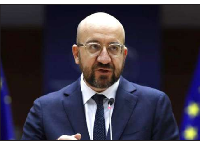
Եւրոպական խորհուրդի ղեկավար՝ Շարլ Միշել

«Կոչ կ'ընեմ հրատապ ապամազլցման եւ կրակի ամբողջական դադրեցման: Իրավիճակը տարածաշրջանին մէջ բարդ է: Եւրոպական Միութիւնը հաւատարիմ է գործընկերներու հետ աշխատելու