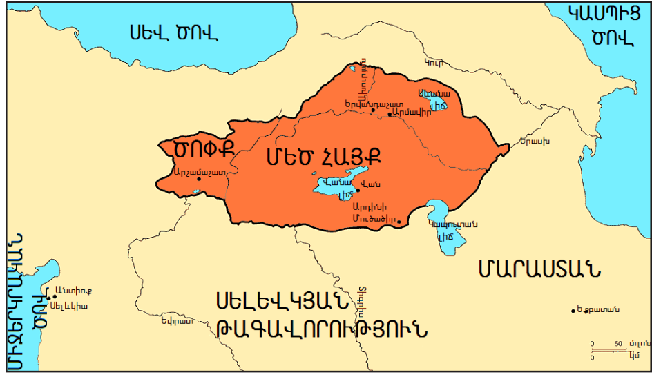
Երուանդունիներու Մեծ Հայքն ու Տօփքը

աջակցութեամբ Կիւրոսը տապալել է Մարաց իշխանութիւնը, յոյներին հնազանդեցրել: Ընթերցողին տպաւորելու համար՝ բառացի մէջբերում եմ Խորենացու խօսքը Տիգրանի մասին. «Եւ ո՞ր իսկական մարդը, որ համակրում է արիական բարքի եւ խոհականութեան, չի զվարճանայ սրա յիշատակութեամբ եւ չի ձգտի նրա նման մարդ լինել: Նա տղամարդկանց գլուխ կանգնեց եւ ցոյց տալով քաջութիւն՝ մեր ազգը բարձրացրեց, եւ մեզ, որ օտարների լծի տակ էինք, դարձրեց շատերին լուծ դնողներ եւ հարկապահանջներ: Մթերքներ ոսկու եւ արծաթի, եւ պատուական քարերի եւ զգեստների եւ զանազան գոյների եւ գործունած քների՝ տղամարդկանց եւ կանանց համար, առհասարակ բազմացրեց, որոնցով տգեղները գեղեցիկների նման սքանչելի էին երեւում, իսկ գեղեցիկներն այն ժամա-