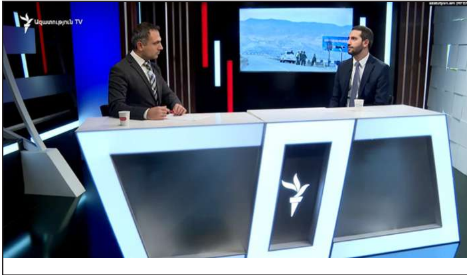
Ազգային ժողովի փոխնախագահ՝ Ռուբէն Ռուբինեան «Ազատութիւն» ռատիոկայանի հետ հարցազրոյցի ընթացքին

«Հայաստանը չմտաւ Ատրպէյճանի՝ միջանցքային տրամաբանութեան մէջ», «Ազատութիւն»-ի «Հարցազրոյց Կարլին Ասլանեանի հետ» հաղորդման ժամանակ ըսաւ Ազգային ժողովի փոխնախագահ՝ Ռուբէն Ռուբինեանը՝ անդրադառնալով Գորիս-Կապան ճանապարհի 21 քիլոմետրանոց հատուածին Ատրպէյճանի տեղադրած անցակէտին: