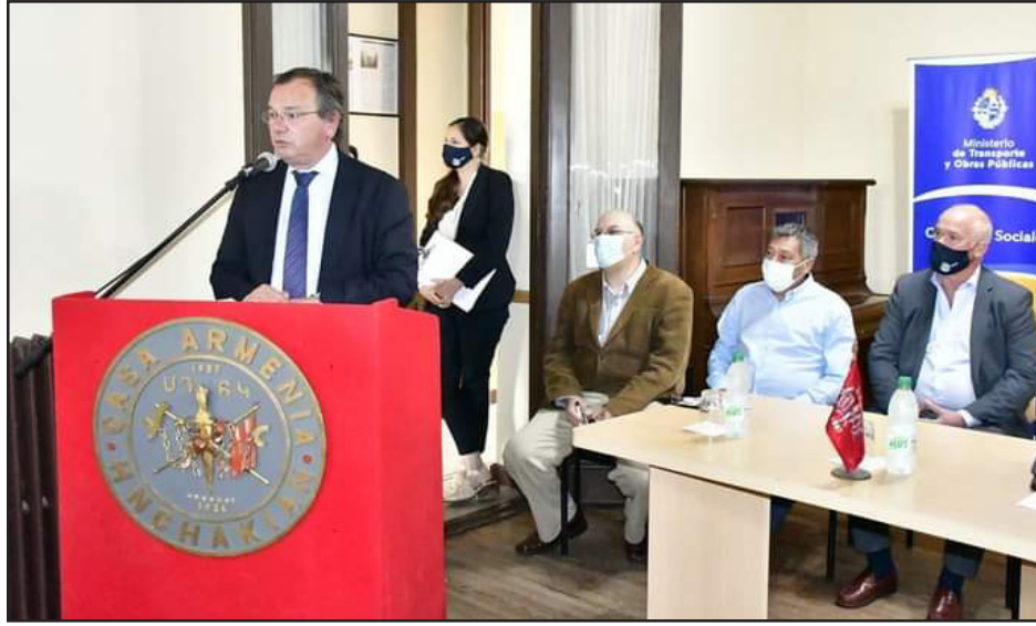
Պաշտօնական հանդիսութեան ընկացքին ելոյթ կ'ունենայ Ուրուկուէյի Շինարարութեան նախարար՝ ժոզէ Լուի Ֆալչիո

ՄԴՀԿ Ուրուկուէյի կեդրոնին մէջ տեղի ունեցած հանդիսութեան ընթացքին, ստորագրուեցաւ փոխհամապորձակցութեան պայմանագիր Ուրուկուէյի Շինարարութեան եւ Փոխադրութեան նախարարութեան եւ «Հնչակեան Հայկական Տան» կազմակերպութեան միջեւ, կուսակցութեան կալուածէն ներս նոր սրահի շինութեան համար: