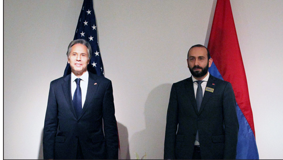
Արարատ Միրզոյեան եւ Թոմ Գլինքըն Սթոքհոլմի մէջ կայացած հանդիպումի ընթացքին

Հայաստանի Արտաքին գործոց նախարար՝ Արարատ Միրզոյեան Սթոքհոլմի մէջ հանդիպած է ԱՄՆ-ի պետական քարտուղար՝ Թոմ Գլինքընի հետ: