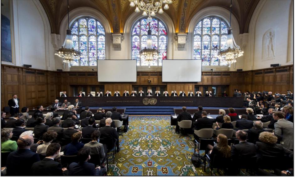
Հաագայի Միջազգային Դատարանի նիստերու դահլիճը

Դեկտեմբեր 7-ին, Հաագայի մէջ գործող ՄԱԿ-ի Արդարադատութեան Միջազգային դատարանը ներկայացուց իր որոշումները Ատրպէյճանի դէմ հրատապ միջոց կիրառելու Հայաստանի դիմումի վերաբերեալ եւ Ատրպէյճանի կողմէ Հայաստանի դէմ դիմումի վերաբերեալ: