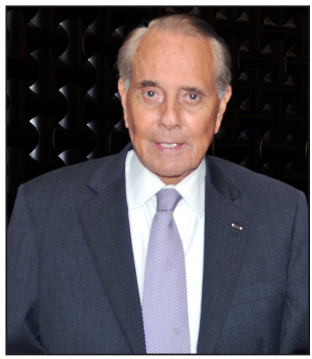
Նախկին ծերակուտական՝ Պոպ Տոլ

98 տարեկանին կեանքէն հեռացած է ամերիկեան քաղաքական դաշտի վեթեռաներէն մէկը՝ նախկին ծերակուտական եւ նախագահութեան թեկնածու՝ Պոպ (Ռոպերթ) Տոլ: