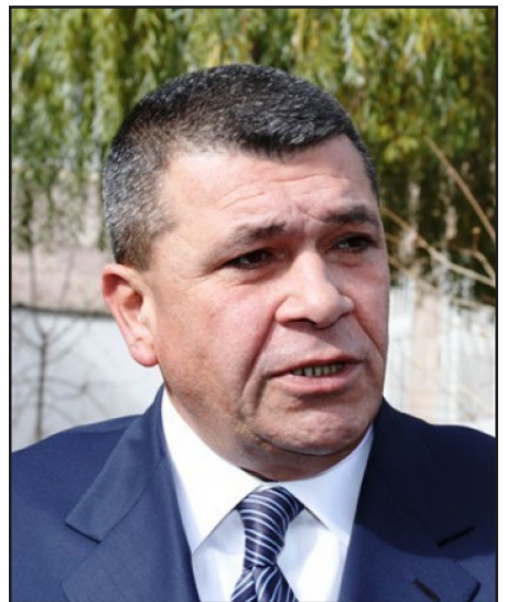
Հայաստանի նախկին ոստիկանապետ՝ Վլատիմիր Գասպարեան

Գլխաւոր դատախազի խորհրդական Գոռ Աբրահամեան «Լուրեր»-ու հետ զրոյցի ընթացքին ըսաւ, որ դատարանը արդէն վարչութիւն ընդունած է գործը: Դատախազութիւնը, միեւնոյն ժամանակ, դեռ չի մանրամասներ, թէ գործով