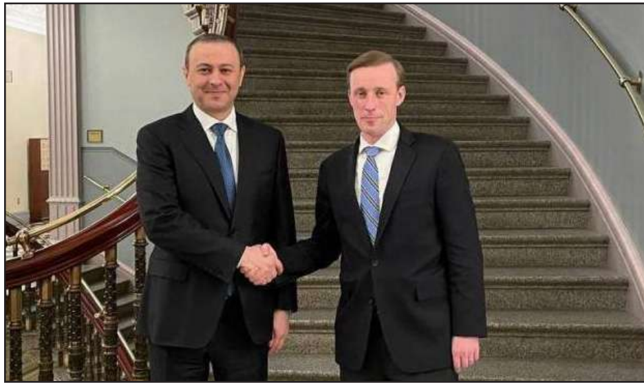
Արմեն Գրիգորեան եւ Ճէյք Սալիվան հանդիպում ԿՈՆԵՏՆԱՆ Ուաշինգթոնի մէջ

Միացեալ Նահանգներ գտնուող ՀՀ Ազգային Անվտանգութեան Խորհուրդի քարտուղար՝ Արմէն Գրիգորեան հանդիպում ունեցած է ԱՄՆ-ի նախագահ՝ Ճօ Պայտրնի Անվտանգութեան Չարցերով Խորհրդական Ճէյք Սալիվանին հետ: