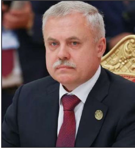
ՀԱՊԿ գլխաւոր քարտուղար՝ Սթանիսլաւ Զաս

«Հաւաքական Անվտանգութեան Պայմանագրի Կազմակերպութիւնը (ՀԱՊԿ) կը սատարէ իրավիճակը քաղաքական ճանապարհով կարգաւորելու Հայաստանի քայլերուն», Երեւան կատարելիք աշխատանքային այցին ընդառաջ «Արմէնփրէսին» տուած հարցազրոյցի ընթացքին յայտարարած է ՀԱՊԿ գլխաւոր քարտուղար՝ Սթանիսլաւ Զաս: