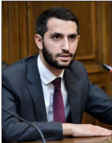
Հայաստանի բանագնաց՝ Ռուբէն Ռուբինեան

Երեւանի եւ Անգարայի կողմէ նշանակուած բանագնացներ՝ Ազգային ժողովի նախագահի տեղակալ՝ Ռուբէն Ռուբինեան եւ Ուաշինկթընի մտաթուրքիոյ նախկին դեսպան՝ Սերտար Քըլըճ շուտով կը հանդիպին, այս մասին յայտնած է Թուրքիոյ արտաքին գործոց նախարար՝ Մեւլուտ Չաւուշօղլուն: