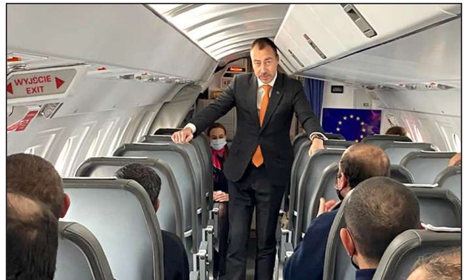
Ազատ արձակուած տասը հայ զինուորները օդանաւին մէջ՝ Եւրոպական Միութեան ներկայացուցիչին հետ

Միացեալ Նահանգները կ'ողջունեն անցեալ շաբթուայ Պրիւքսէլի մէջ Հայաստանի վարչապետ Նիկոլ Փաշինեանի եւ Ատրպէյճանի նախագահ Իլհամ Ալիեւի բանակցութիւններէն յետոյ 10 հայ զինուորներու ազատ արձակումը: Այս մասին Թուրքիոյ իր էջով գրած է Պետական բաժանմունքի խօսնակ՝ Նէտ Փրայս: