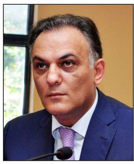
Երեւանի նախկին քաղաքապետ Գագիկ Բեգլարեան

Բացի գույքի ծագման ստուգումներէն, Գագիկ Բեգլարեան նաեւ մեղադրեալ է դրամաւուացման՝ մօտ 480 հազար տոլար արժողութեամբ պետական գույքը յափշտակելու գործով: Ամիսներ տեւած հետախուզումէն յետոյ ան ձերբակալուած է այս Մայիսին «Զուարթնոց» օդակայանը, ապա մէկ օրուայ կալանքէն յետոյ ազատ արձակուած է 105 հազար տոլար գրաւի դիմաց: Դատախազութեան «Ազատութիւն»-ին հաղորդած էին, որ իրաւապահներուն ինքնակամ ներկայացած Բեգլարեան դատախազութեան աւանդի հաշուոյն փոխանցած է մեղադրանքի համաձայն պետութեան պատճառած վնասին համարժէք գումարը եւ այս հանգամանքն ալ հաշուի առնելով՝ դատախազը որոշած էր զինք ազատ