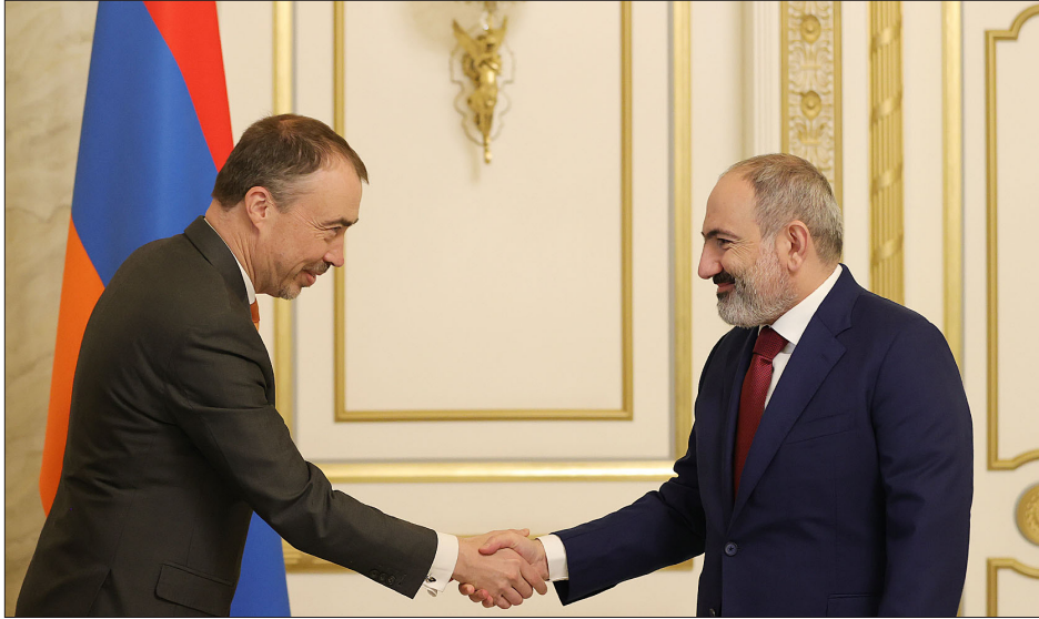
Նիկոլ Փաշինեան-Թոյվո Քլարր հանդիպումը Երեւանի մէջ

Վարչապետ Նիկոլ Փաշինեան ընդունած է Հարաւային Կովկասի ու Վրաստանի ճգնաժամի հարցերով Եւրոպական Միութեան յատուկ ներկայացուցիչ Թոյվո Քլարարը: Հանդիպման ներկայ եղած են նաեւ Հայաստանի մէջ ԵՄ պատուիրակութեան ղեկավար, դեսպան Անտրէա Վիքթորինը: