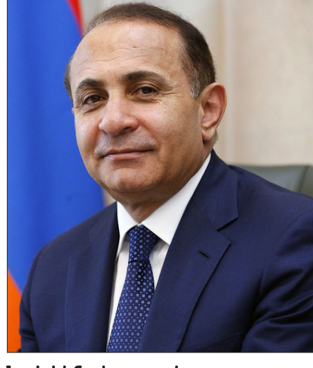
Նախկին վարչապետ Յովիկ Աբրահամեան

Նախկին վարչապետ Յովիկ Աբրահամեան յաջողած է վաճառել Մոնումենթի մէջ կառուցած շքեղ առանձնատունը, թէեւ Դատախազութիւնը դեռ երկու տարի առաջ արգիլած էր Կաղաստրի կոմիտէին անոր շուրջ որեւէ գործարք կատարել: «Ազատութիւն»ը փորձած է Գլխաւոր Դատախազութենէն պարզել, թէ ո՞վ եւ ինչո՞ւ թոյլատրած է դղեակի վաճառքը, որու ձեռք բերման օրինականութիւնը տարիներ շարունակ կասկածի տակ կը դրուէր՝ ամենաբարձր մակարդակով: