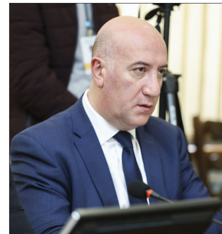
Պաշտպանութեան նախարարի տեղակալ Արման Սարգսեան

«Զինուած Ուժերը համալրուել է ուղղաթիռներով, ԱԹՍ-ներով, հրթիռահրետանային, հակահրատարակչային, հրետանային կապի, ճարտարապետական, հրաձգային, ռազմատեղեկագրական միջոցներով, զրահապատ մեքենաներով եւ այլն: Համալրումը կատարուած է կազմ-կառուցուածքային փոփոխութիւնների արդիւնքում առկայ կարիքների հաշուարկով, ընդ որում մատակարարումների մի մասը նախատեսուած է իրականացնել ՀՀ ռազմարդիւնաբերական համալիրի կազմակերպութիւնների միջոցով», ըսած է