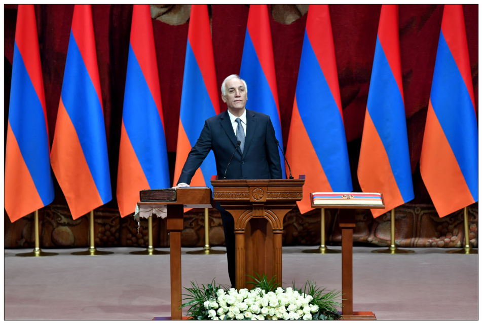
Նախագահ Վահագն Խաչատուրեան Վեհաժողովի Աւետարանի վրայ երդում տալու պահուն

Հայաստանի Հանրապետութեան Ազգային Ժողովի յատուկ նիստին, որ տեղի ունեցաւ Կիրակի, Մարտ 13-ին Վահագն Խաչատուրեան երդմամբ ստանձնեց Հանրապետութեան նախագահի պաշտօնը: Վահագն Խաչատուրեան, ձեռքը դնելով Վեհաժողովի Աւետարանի եւ ՀՀ Սահմանադրութեան վրայ, երդուեց . «Ստանձնելով Հանրապետութեան նախագահի պաշտօնը՝