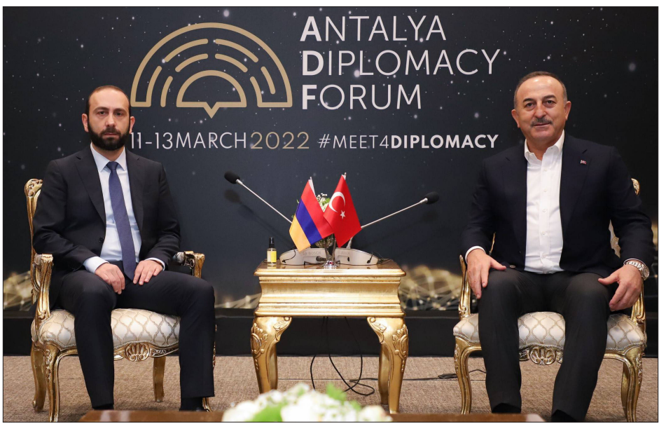
Արարատ Միրզոյանի եւ Մելիք Չաուուշողլուի միջեւ կայացած համաձայնութիւնի ընթացքին

Ատրպէյճանի հետ խաղաղութեան պայմանագրին շուրջ բանակցութիւնները պէտք է ընթանան առանց նախապայմաններու, ըսած է Հայաստանի արտաքին գործերու նախարար Արարատ Միրզոյեան, անդրադառնալով Պաքուի հրապարակած 5 կետոց առաջարկին: Արտաքին գործերու նախարարը նկատած է, որ Պաքուի առաջարկած կէտերը ամբողջութեամբ չեն արտացոլեր առկա խնդիրներու ամբողջ օրակարգը: «Ինչ վերաբերում է բուն առաջարկներին, ապա երկու երկրներն, ըստ էութեան, դեռեւս 1991 թուականի Դեկտեմբերի 8-ին համատեղ ստորագրելով «անկախ պետութիւնների համագործակցութեան ստեղծման մասին» համաձայնագիրը, արդէն իսկ ճանաչել են միմեանց տարածքային ամբողջականութիւնը եւ ընդունել են, որ չունեն միմեանց նկատմամբ տարածքային պահանջներ», ըսած է արտաքին քաղաքական գերատեսչութեան ղեկավարը: Միրզոյեանի խօսքով՝ հսկայական կողմին համար սկզբունքային եւ հիմնարար է, որ յստակ երաշխաւորուին արցախահայութեան իրաւունքները եւ ազատութիւնները: