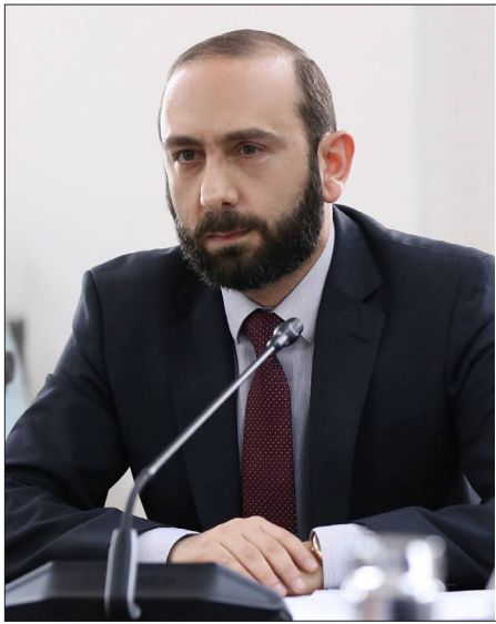
ՀՀ արտաքին գործոց նախարար Արարատ Միրզոյեան

«Ուզում եմ վերահաստատել հայկական կողմի պատաստակամութիւնը՝ սահմանագոտում ձեռնարկել կայունութեան բարձրացման քայլեր եւ այնուհետեւ ձեռնամուխ լինել նաեւ Հայաստան-Ատրպէյճան սահմանագատման գործընթացի մեկնարկին: Ուզում