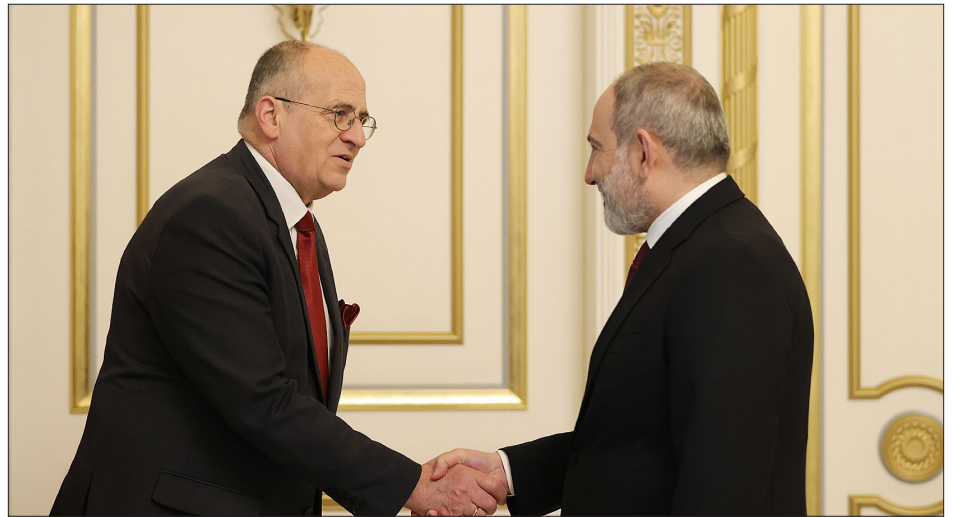
ԵԱՀԿ գործող նախագահ Ջաչկինե Ռաու եւ վարչապետ Նիկոլ Փաշինեան Երեւանի մէջ կայացած հանդիպումի ընթացք

ԵԱՀԿ-ի յայտարարութեան մէջ կը նշուի, որ Ջաչկինե Ռաուի ուղեւորութիւնը կեդրոնացած էր անվտանգութեան առկայ մարտահրաւերներուն եւ կայուն խաղաղութեան ուղղուած ջանքերուն, ինչպէս նաեւ ԵԱՀԿ-ի եւ Հարաւկովկասեան տարածաշրջանի երեք պետութիւններուն միջեւ համագործակցութեան ամրապնդման վրայ: Կառավարութեան նիստին վարչապետ Նիկոլ Փաշինեան յայտնած է, որ խաղաղութեան բանակցութիւններուն Հայաստանը պատրաստ է լրացուցած առաջարկներու հիմքին վրայ: Փաշինեանի