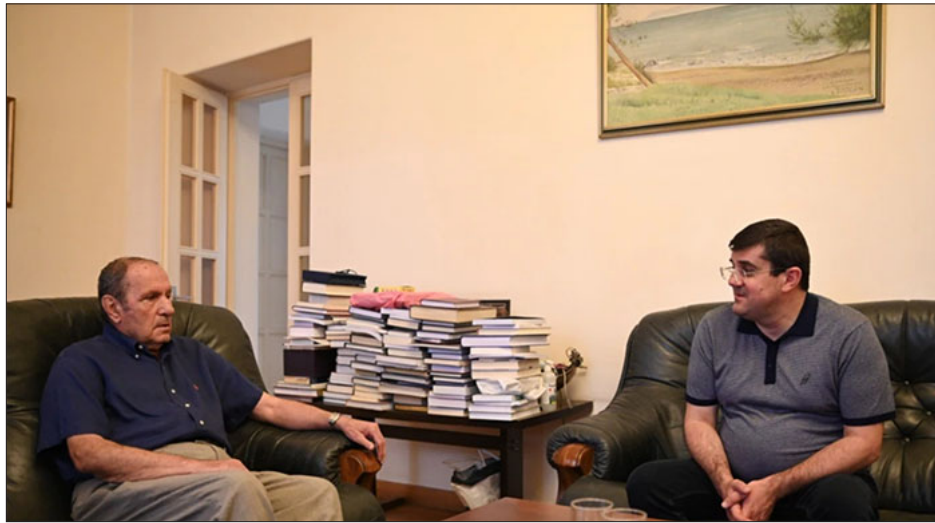
Առաջին Նախագահ Լեւոն Տէր Պետրոսեան իր առանձնատան մէջ կ'ընդունի Արցախի Նախագահ Արայիկ Յարութիւնեանը

ՀՀ առաջին նախագահ Լեւոն Տէր Պետրոսեան իր առանձնատան մէջ հանդիպած է ԼՂՀ նախագահ Արայիկ Յարութիւնեանի հետ: Ջրոյցի ընթացքին երկուստեք կարեւորուած է, որ ռուս-ուքրանական պատերազմի ընթացիկ փուլին մէջ, թէ՛ Արցախի ու