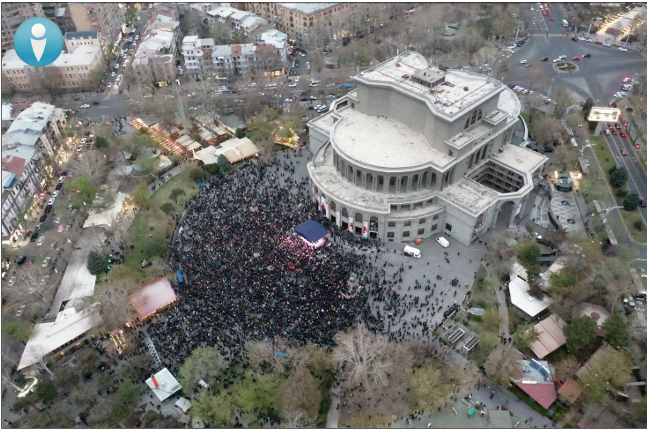
Խորհրդարանական ընդդիմադիր ուժերուն հանրահաւաքը Ազատութեան հրապարակին վրայ

Ապրիլի 5-ին, Երեւանի Ազատութեան հրապարակին վրայ տեղի ունեցաւ խորհրդարանական ընդդիմադիր ուժերուն կողմէ հրաւիրուած հանրահաւաքը: «Պաշտպանելով Արցախը՝ պաշտպանենք Հայաստանը» կարգախօսով հանրահաւաքի աւարտին ցուցարարները շարժեցան դէպի Ֆրանսայի հրապարակ: Հանրահաւաքին ունկնդրի կարգավիճակով ներկայ էր նաեւ Հայաստանի երրորդ նախագահ