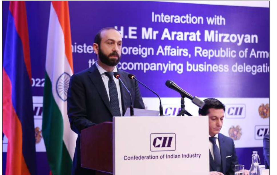
Նախարար Արարատ Սիրգոյեան ելոյթ կ'ունենայ հայ-ինդկական գործարար համաժողովի ընթացքին

«Այսօր մենք իրապէս նոր էջ ենք բացում հայ-ինդկական տնտեսական համագործակցութեան պատմութեան մէջ, եւ թոյլ տուէք ասել՝ վերականգնում ենք մեր ժողովուրդների միջեւ առեւտրի, զարգացման եւ բարգաւաճման հիանալի աւանդոյթները», Նիւ Տելհիի մէջ՝ հայ-ինդկական գործարար համաժողովի բացման ընթացքին ըսած է Հայաստանի արտաքին գործերու նախարար Արարատ Սիրգոյեանը: