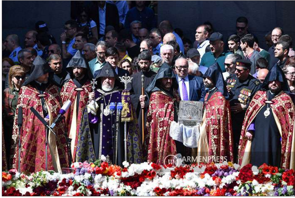
Գարեգին Բ. Ամենայն Հայոց Կաթողիկոսը Սուրբ Էջմիածնի միաբաններուն հետ բարեխօսական կարգ կը կատարէ եղեռնի Յուշարձանին մօտ

«Հէնց այդ պատճառով է Հայաստանի Հանրապետութիւնը միջազգային ասպարէզում հետեւողական պայքար մղում ցեղասպան