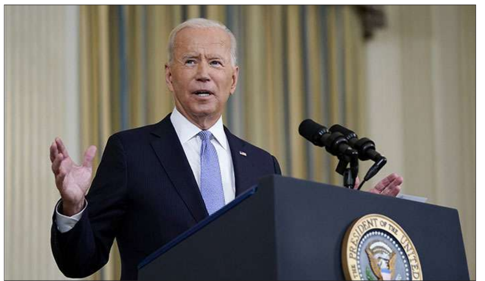
Միացեալ Նահանգներու նախագահ՝ Դո Պայտըն

Միացեալ Նահանգներու նախագահը հրապարակեց իր ապրիլ քսանչորսեան ուղերձը, որուն մէջ, ինչպէս նախորդ տարի, Ժո Պայտըն օգտագործած է Հայոց Յեղասպանութիւն եզրոյթը՝ քանի մը անգամ: