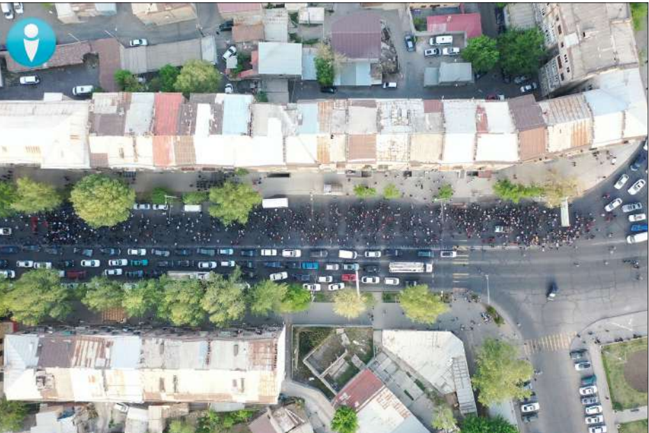
«Դիմադրութիւն» շարժումի երթը Երեւանի Սեջ, որուն մասնակցած է շուրջ 1200 հոգի

Խորհրդարանական երկու ընդդիմադիր դաշինքներու նախաձեռնած փողոցային շարժումները իրենց ակնկալած արդիւնքը չեն տար: Հանրային լայն շրջանակները անարձագանգ կը թողնեն «Դիմադրութիւն» շարժումին «Ջարթ-նիր լաօ» կոչերը: Կարելի չ'ըլլար գորաշարժի ենթարկել 2-3 հազարէն աւելի ցուցարար: Ի տարբերութիւն «Հայրենիքի Փրկութեան Շարժման» առաջին փուլին, որ մեկնարկած էր 2020 թուականի Նոյեմբեր 10-ին, այս անգամ ընդդիմութեան ներկայացուցիչները քիչ մը փոխած են մարտավարութիւնը, բեմահարթակը տրամադրած են աւելի երիտասարդ ներկայացուցիչներու, իսկ իրական առաջնորդները կը նախընտրեն մասնակցիլ շարժումներուն ցուցարարներու շարքերուն մէջ: