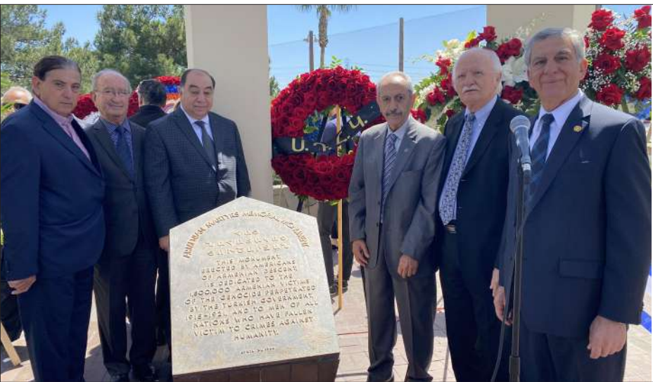
ՄԴՀԿ պատուիրակուծիւնը Մոնթեպելլոյի եղեռնի Յուշարձանին մօտ

Շաբաթ օր, Ապրիլ 23-ին, Հայոց ցեղասպանութեան 107-րդ տարելիցին առթիւ Մոնթեպելլոյի Եղեռնի Յուշարձանի առջեւ տեղի ունեցաւ ծաղկեպսակի գետեղման եւ հոգեհանգստի յատուկ արարողութիւն: