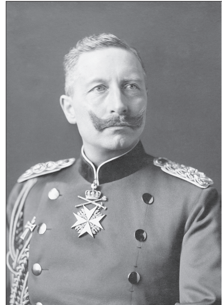
Գերմանիոյ Վիլհելմ Բ. կայսրը

Կորսուած հողերու վերագ- րաման եւ վրէժ լուծելու փափաքը թուրք ազգայնականութեան վայ- րագ ուղղութիւն մը կու տայ: Այն վրէժը, որ «գինեպան յոյն»-էն, «խոզարած սերպ»-էն, «կաթնա- վաճառ պուլկար»-էն չէին կրցած առնել, հայաշատ շրջաններ տեղա- ւորուած գաղթականներու՝ «մու- հաճիթ»-ներու օգնութեամբ Առա- ջին Աշխարհամարտի ընթացքին հայերէն կ'առնեն՝ «մեզի կոնակէն զարկին» պատճառաբանութեամբ: