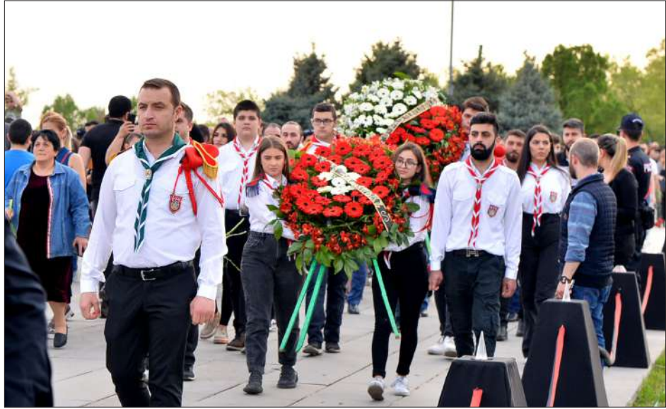
ՀՄՍ-ի սկաուտները կ'այցելեն Ծիծեռնակաբերդի յուշահամալիր

Ապա ան յաւելած է, որ նաեւ այս է պատճառը, որ Հայաստանի եւ Թուրքիոյ միջեւ յարաբերութիւններու կարգաւորման միտումնաւոր քննարկումներ կը վարեն՝ յոյս յայտնելով, որ Թրքական կողմին ձգտումները անկեղծ են, եւ