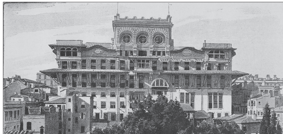
Օսմանեան դրամատունը (Պանք Օթոման)

«Վանի մեծ դէպքը»: Բանակը քաղաքի հայկական թաղերու պաշտպան տղամարդիկը քաղաքէն հեռացնելէ յետոյ, թէ՛ այդ տղամարդիկը եւ թէ՛ տեղացիներ կը ջարդէ: Հազարաւոր դիակներ շաբաթներով անթաղ կը մնան: