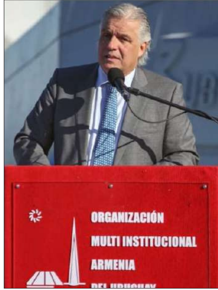
Նախարար Ֆրանսիսքօ Պուլիթիօ ելոյթ կ'ունենայ «Արմենիա» հրատարակին վրայ

Թուրքիոյ արտաքին գործոց նախարար Մեւլութ Չաւուշօղլուի Ուրուկուէյ այցելութեան ընթացքին տեղի ունեցած է սկանտալ: Մոնթեվիտէոյի Թրքական դեսպանութեան առջեւ հաւաքուած հայերու բողոքներ