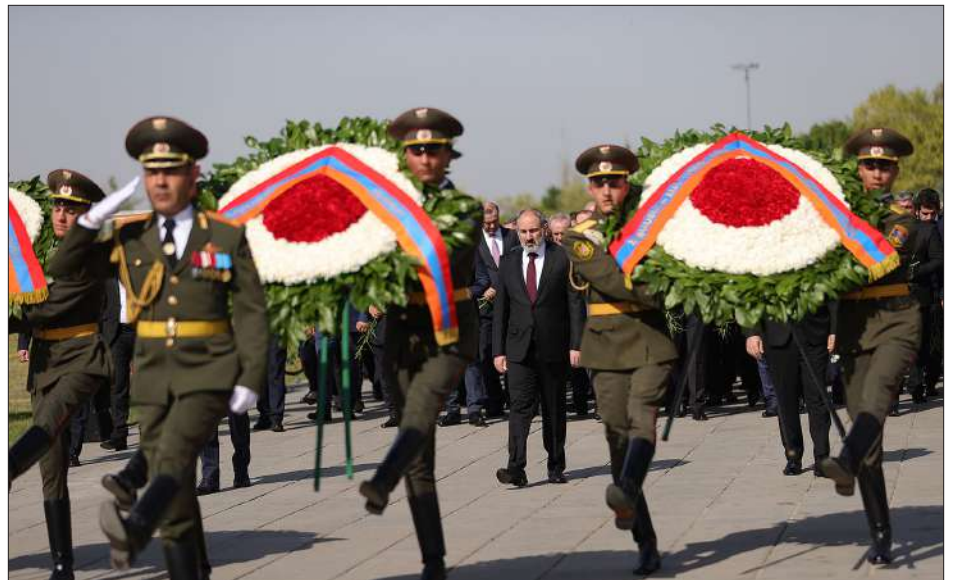
Զինուորական արարողութեամբ նախագահին ու վարչապետին ծաղկեպսակները կը մօտենան Ծիծեռնակաբերդի Յուշարձանին

Եղեռնի 107-րդ տարելիցին առիթով չղած իր ուղերձին մէջ վարչապետ Նիկոլ Փաշինեան կը նշէ, որ պատմական փաստերու, ցեղասպանութիւններու եւ ոճրագործութիւններու հերքումը, խեղաթիւրումը, ճշմարտութեան հետ ուղղութեամբ: