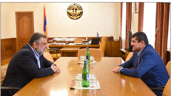
Արայիկ Յարութիւնեան եւ Ռուբէն Վարդանեան վերջերս կայացած հանդիպումի ընթացքին

Ռուբէն Վարդանեանը պիտի նշանակուի Արցախի Հանրապետութեան պետական նախարարի պաշտօնին: Այս մասին կը տեղեկացնէ Արցախի նախագահ Արայիկ Յարութիւնեանը.