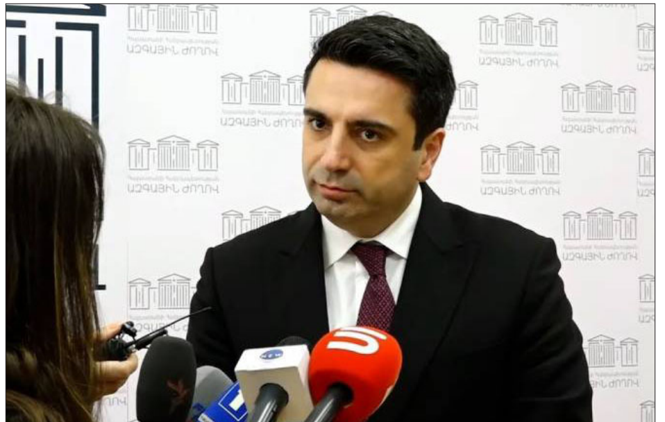
Ազգային ժողովի նախագահ Ալէն Սիմոնեան խորհրդարանէն ներս լրագրողներու հետ զրոյցի ընթացքին

Ազգային ժողովի նախագահ Ալէն Սիմոնեանը կը պնդէ, որ ինք տեղեակ չէ, որ Ռուսիան կը փափաքի Հայաստանը դարձնել Ռուսիա-Պելառուսիա միութեան կազմէն: Սիմոնեան կ'ըսէ, որ Ռուսիան կ'ըսէ, որ ինք տեղեակ չէ, որ Ռուսիան կը փափաքի Հայաստանը դարձնել Ռուսիա-Պելառուսիա միութեան կազմէն: