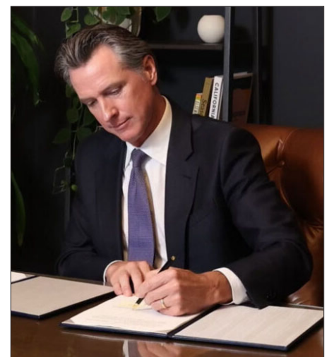
Քալիֆորնիոյ նահանգապետ Կելըն Նիւսըմ

Օրինագիծը կը յայտարարէ, որ Յեղասպանութեան յիշատակի օրը բոլորի համար կը դառնայ անցեալ եւ ներկայ ցեղասպանութիւններու մասին անդրադառնալու օր, բայց չատկապէս անոնց համար, որոնք զգացած են այս վայրագութիւններու ազդեցութիւնը, որոնք ապաստան գտած են Քալիֆորնիոյ մէջ: Ապրիլ 24-ի օրը կը լինի Հոլոքոստը, Հրլոյտօրը եւ հայ, ասորի, յոյն, քամպուիական