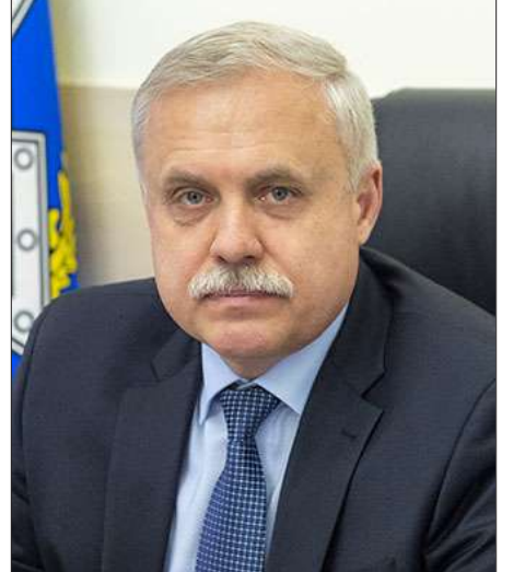
ՀԱՊԿ գլխաւոր քարտուղար Սթանիսլաւ Զաս

տեղի ունեցած ՀԱՊԿ Հաւաքական Անվտանգութեան Խորհուրդի հերթական նիստին ՀՀ վարչապետ Նիկոլ Փաշինեան մերժած էր ստորագրել ՀԱՊԿ Հաւաքական Անվտանգութեան Խորհուրդի հռչակագիրն եւ Հայաստանի Հանրապետութեան օժանդակութիւն ցուցաբերելու համատեղ միջոցառումներու մասին փաստաթուղթերը: