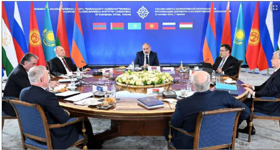
ՀԱՊԿ գագաթաժողովի նիստը Երեւանի մէջ

Հայաստանի վարչապետ Նիկոլ Փաշինեան ցաւով կը նշէ, որ Երեւանի մէջ Նոյեմբեր 23-ին կայացած ՀԱՊԿ Հաւաքական Անվտանգութեան Խորհուրդի հերթական նիստին չեն յաջողած ընդհանուր յայտարարի գալ երկու շատ կարեւոր փաստաթուղթերու վերաբերեալ: Սակայն, չնայած այդ հանգամանքին, Փաշինեան դրական կը գնահատէ ՀԱՊԿ նիստի ընթացքին տեղի ունեցած քննարկումը: