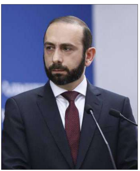
Հայաստանի արտաքին գործերու նախարար Արարատ Միրզոյեան

Անդրադառնալով Ատրպէյճանի նախագահին յայտարարութեան,