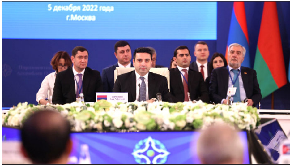
Ալէն Սիմոնեանը ելոյթ կ'ունենայ ՀԱՊԿ Խորհրդարանական Վեհաժողովի Խորհուրդի համատեղ նիստին

ՀՀ Ազգային Ժողովի նախագահ Ալէն Սիմոնեանը Դեկտեմբեր 5-ին ելոյթ ունեցած է Հաւաքական Անվտանգութեան Պայմանագրի կազմակերպութեան Խորհրդարանական Վեհաժողովի Խորհուրդի համատեղ նիստին: Սիմոնեան, մասնաւորապէս, ըսած է, որ վերջին տարիներուն աշխարհաքաղաքական հարթութեան մէջ կ'ուրուագծուին քաղաքական իրողութիւններ, որոնք յառաջիկային պիտի նախանշեն միջազգային յարաբերութիւններու միջակայքին վերափոխումը, եւ այս ծիրին մէջ է, որ տարածաշրջանային անվտանգութեան կազմակերպութիւնները պէտք է աւելի մեծ աշխուժութիւն ցուցաբերեն: Ան մանրամասնած է Սեպտեմբերին ՀՀ տարածք ներխուժած ատրպեյճանական զինուորի իրականացուցած ռազմական գործողութիւնները՝ չի շեղելով, որ յարձակման նոր փուլին ատրպեյճանցիները բռնազրուած են Հայաստանի Հանրապետութեան ինքնիշխան տարածքէն որոշակի հատուածներ: Ան շեշտած է, որ պաշտօնական Պաքուի ռազմատեսչ հռետորաբանութիւնը կը վկայէ Ատրպեյճանի հետագայ ծաւալապաշտական նկրտումներու մասին: «Այս բարդ իրավիճակում Հայաստանի համար չափազանց կարեւոր էր ՀԱՊԿ-ում մեր գործընկերների ռազմական եւ քաղաքական աջակցութիւնը, եւ հայկական կողմը նախանշել է իր ակնկալութիւնները: