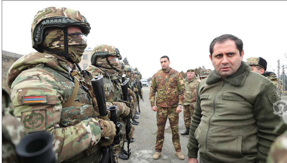
Հայաստանի պաշտպանութեան նախարարը կը հանդիպի Յատուկ Նշանակութեան զինուորներուն հետ

Հայաստանի պաշտպանութեան նախարար Սուրէն Պապիկեան ՀՀ Զինուած Ուժերու Գլխաւոր Շտաբի պետ, պաշտպանութեան նախարարի առաջին տեղակալ էտուարտ Ասրեանի եւ Լոռիի մարզպետ Արամ Խաչատրեանի ուղեկցութեամբ այցելած է «N» բանակային զօրամի-