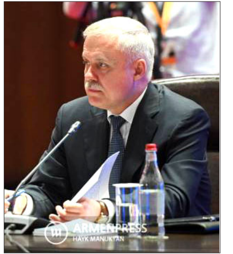
ՀԱՊԿ գլխաւոր քարտուղար Սթանիսլաւ Զաս

«Յոյսով եմ, որ որոշակի լրամշակումէ յետոյ կը հասնինք այս որոշման նախագիծի ստորագրման եւ համապատասխան միջոցներու ձեռնարկման: Վստահ եմ, որ այդ անհրաժեշտ է, այդ շարքին՝ Հայաստանի համար», ընդգծած է Զաս: Զաս ընդգծած է, որ հայատրպեյճանական սահմանին իրա-