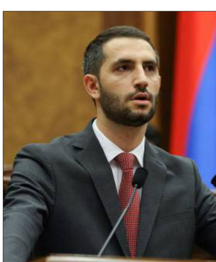
ԱՎ փոխնախագահ Ռուբինեան

Ազգային ժողովի փոխնախագահ Ռուբինեան պարզաբանեց, թէ ինչու խորհրդարանը չի կրնար ընդունիլ ընդդիմադիր «Հայաստան» խմբակցութեան ներկայացուցած յայտարարութեան նախագիծը, որ կ'առաջարկուէր ընդունիլ ի պատասխան Ատրպէյճանի խորհրդարանի՝ Նոյեմբեր 8-ի յայտարարութեան: