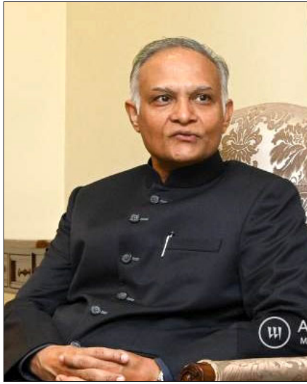
Չարանճիթ Սինկիը արտաքին գործոց նախարարութեան Եւրասիոյ բաժնի պաշտօնէայ Չարանճիթ Սինկիը:

Հնդկաստանի արտաքին գործոց նախարարութեան Եւրասիոյ բաժնի պաշտօնէայ Չարանճիթ Սինկիը գոհունակութեամբ արձանագրեց, որ Հնդկաստանի եւ Հայաստանի միջեւ յարաբերութիւնները ընդլայնուած եւ խորացած են: Ինչպէս տեղեկացուց «Արմէնիք»-ը, Սինկիը այս մասին յայտարարեց «Հայաստան-Հնդկաստան. հազարամեայ յարաբերութիւններու նոր խթաններ» գիտաժողովի ժամանակ արտասանած իր բացման խօսքին մէջ: