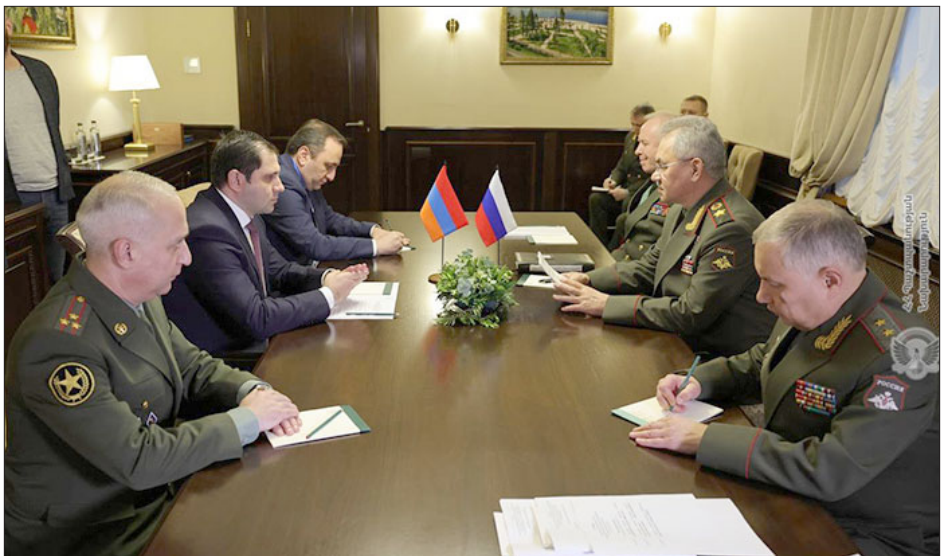
Ռուսիոյ պաշտպանութեան նախարար Սերկէյ Շոյկու. Հայաստանի իր պաշտօնակից Սուրէն Պապիկեանի հետ հանդիպման ընթացքին

Հայաստանը Ռուսիոյ առանցքային ռազմավարական գործընկերն է Անդրկովկասի մէջ, յայտնած է Ռուսիոյ պաշտպանութեան նախարար Սերկէյ Շոյկուն, Մոսկուայի մէջ հայաստանցի պաշտօնակից Սուրէն Պապիկեանի հետ հանդիպման ընթացքին: Հանդիպումը կայացած է Շանկհայի Համագործակցութեան կազմակերպութեան եւ ԱՊՀ երկիրներու պաշտպանական գերատեսչութիւններու ղեկավարներու նիստի ծիրին մէջ: «Հայաստանը մեր դաշնակիցն է ՀԱՊԿ-ի մէջ եւ առանցքային ռազմավարական գործընկերը՝ Անդրկովկասի մէջ: Մենք չափազանց շահագրգռուած ենք տարածաշրջանին մէջ կայունութեան պահպանման հարցով եւ անոր համար կը գործադրենք բոլոր ջանքերը: Մենք առանձնապատուկ կարեւորութիւն կու տանք երկկողմ համագործակցութեան զարգացման եւ Հայաստանի Զինուած Ուժերու ներուժը մեծցնելուն ուղղուած