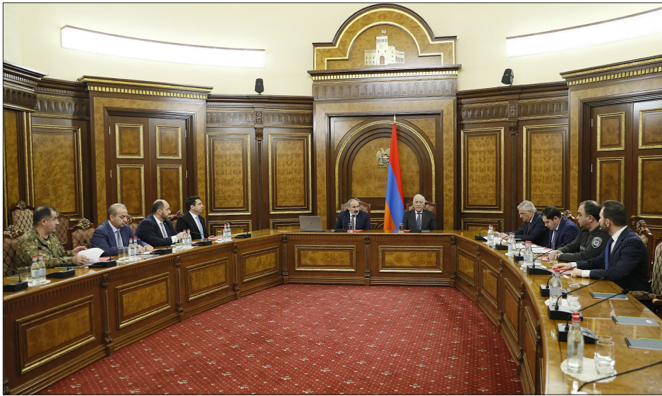
Նիկոլ Փաշինեանի գլխավորութեամբ տեղի ունեցած է Անվտանգութեան Խորհուրդի արտահերթ նիստը

ՀՀ վարչապետ Նիկոլ Փաշինեանի գլխավորութեամբ տեղի ունեցած է Անվտանգութեան Խորհուրդի արտահերթ նիստը: Ըստ Հայաստանի կառավարութեան՝ քննարկուած են տարածաշրջանին մէջ տեղի ունեցող զարգացումները, մասնաւորապէս, Լաչինի միջանցքին մէջ ստեղծուած իրավիճակը: Բացի ԱԽ անդամներէն, նիստին մասնակցած են նաեւ նախագահ Վահագն Խաչատուրեանը, Ազգային ժողովի նախագահ Ալէն Սիմոնեանը, վարչապետի աշխատակազմի ղեկավար Արայիկ Յարութիւնեանը, ԱԺ «Քաղաքացիա-