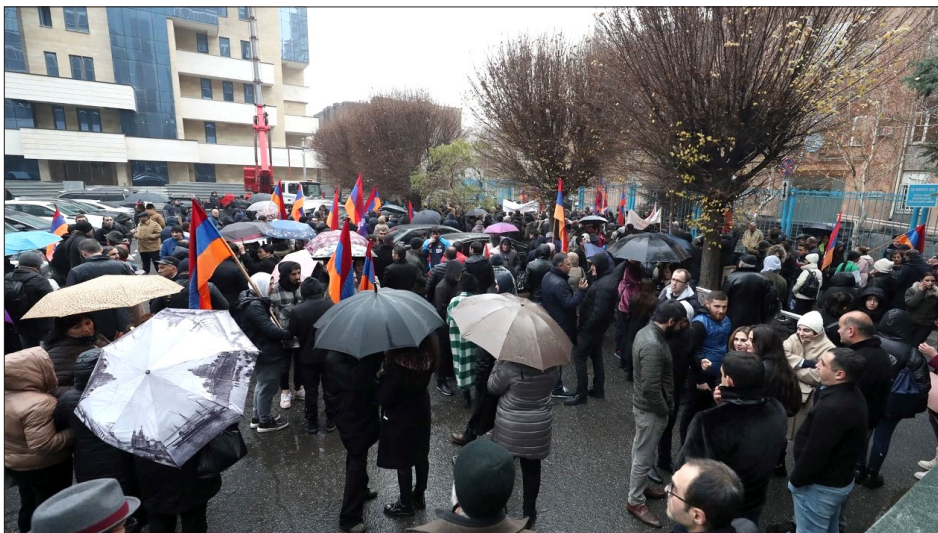
Երեւանի սեչ բողոքի ցոյց՝ Լաչինի միջանցքի փակման դեմ

Արցախը Հայաստանին կապող միակ ճանապարհի՝ Լաչինի միջանցքի փակ ըլլալուն պատճառով բազմաթիւ արցախցիներ, անոնց շարքին երեխաներ արդէն երկրորդ օրն է Հայաստանի մէջ են, չեն կրնար վերադառնալ տուն: