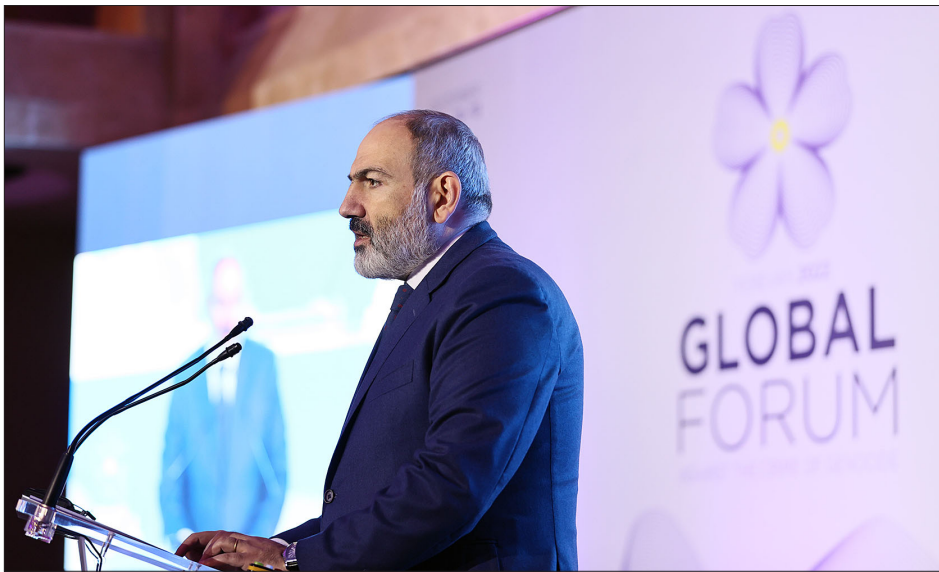
ՀՀ վարչապետ Նիկոլ Փաշինեան ելոյթ կ'ունենայ «Ընդդէմ Ցեղասպանութեան Յանցագործութեան» համաշխարհային համագումարին ժամանակ

Զրուցակիցները քննարկած են Լաչինի միջանցքին մէջ ստեղծուած իրավիճակի հանգուցալուծման վերաբերող հարցեր: Վարչապետ Փաշինեան կարեւորած է Հայաստանի եւ Լեռնային Ղարաբաղի միջեւ անխափան կապի ապահովումը: