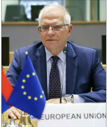
ԵՄ դիւանագիտութեան ղեկավար Ժոզեփ Դորէլ

Պրիւքսէլը պիտի չերկարածգէ Հայաստանի մէջ Եւրոմիութեան դիտորդական առաքելութեան մանտաքի ժամկէտը, որ կ'աւարտի յաջորդ շաբաթ, այս մասին յայտարարած է Եւրոմիութեան դիւանագիտութեան ղեկավար Ժոզեփ Դորէլը՝ նշելով, որ նման որոշում կայացուած է Եւրոմիութեան անդամ երկիրներու արտաքին գործերու նախարարներու Պրիւքսէլի մէջ տեղի ունեցած նիստին: Պորէլի գնահատմամբ՝ առաքելութեան աշխատանքը «արդիւնաւէտ» էր, բայց առաքելութեան ժամկէտը չերկարածգելու պատճառներու մասին չխօսեցաւ, միայն նշեց, որ «ե՛ւ Հայաստանի, ե՛ւ Ատրպէյճանի հետ պայմանաւորուածութեան համաձայն» առաքելութիւնը իր գործունէութիւնը Դեկտեմբեր 19-ին պէտք է աւարտէ: «Այդուհանդերձ, Հայաստանի եւ Ատրպէյճանի միջեւ երկխօսութեան միջնորդի մեր հեղինակութիւնը պահպանելու համար Հայաստան պիտի ուղարկուի խումբ մը, որ պէտքի ծրագրէ հնարաւոր քաղաքացիական առաքելութեան ուղարկումը, եթէ յաջորդ տարի նման համաձայնութիւն ձեռք բերուի», յայտնած է Պորէլը: