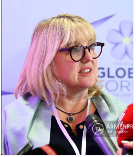
Լեմքինի Հիմնարկի համահիմնադիր էլիզա վօն ձոյտըն-Ֆորկին

Անդրադառնալով դիտարկման, որ Ատրպեյճանի նախագահը ցեղասպանութիւն կը նախատեսէ Լեռնային Ղարաբաղի հայերու դէմ եւ հարցին, թէ այս առումով ի՞նչ կրնայ ընել միջազգային հանրութիւնը՝ կանխելու նոր ցեղասպանութիւնը՝ ան ըսաւ, որ միջազգային հանրութիւնը կրնայ շատ աւելին ընել, քան արդէն ըրած է՝ կանխելու նոր ցեղասպանութիւնը: