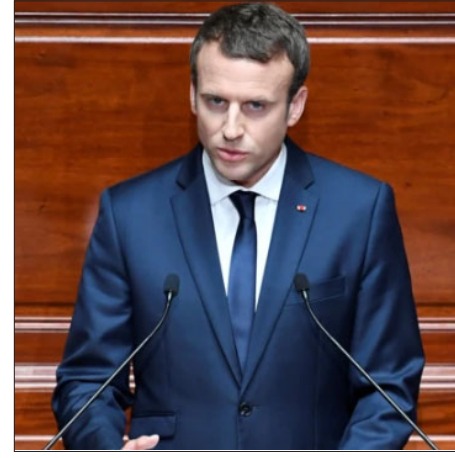
Ֆրանսային նախագահ Էմանուէլ Մաքրոն

Նամակին հեղինակները կը շեշտեն, որ ստեղծուած իրավիճակը 2020 թուականէն ի վեր հայերու, ընդ որում՝ ինչպէս Արցախի մէջ ապրող, այնպէս ալ Հայաստանի