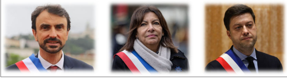
Lyon Mayor Grégory Doucet, Paris Mayor Anne Hidalgo, Marseille Mayor Benoît Payan

PARIS (Armradio) -- The Mayors of the three largest French cities – Paris, Lyon and Marseille – have called on the French Government and the European Union to impose sanctions against Azerbaijan. The Mayors made the appeal in a joint article published by Libération newspaper.