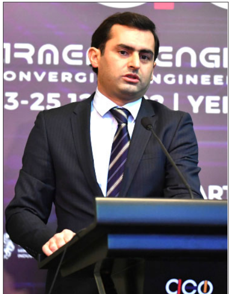
Ազգային Ժողովի փոխնախագահ Յակոբ Արշակեան

Պաշտպանական արդիւնաբերութեան ոլորտին մէջ եւս հիմնարար փոփոխութիւններ արձանագրուած են: «Խօսքը մշակուածներից դէպի շարունակական արտադրութեան ցիկը արձանագրուած է: Այստեղ եւս ձեռքբերումներ կան, ինչի վրայ ազդեցութիւն է թողել երկարաժամկէտ պատուէրների հիմնարկի ներդրումը», հաւաստիացուց Յակոբ Արշակեանը: