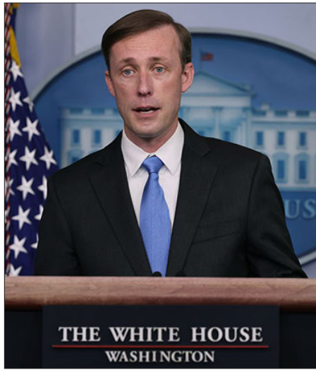
ԱՄՆ անվտանգութեան հարցերով խորհրդակա ձէյք Սալիվան

«Ազգային անվտանգութեան հարցերով խորհրդակա ձէյք Սալիվան անուանին հեռախօսագրոյցներ ունեցաւ Հայաստանի Անվտանգութեան Խորհուրդի քարտուղար Արմէն Գրիգորեանի եւ Ատրպէյճանի նախագահի աշխատակազմի Արտաքին Յարաբերութիւններու Վարչութեան պետ Հիքմէթ Հաճիբեհի հետ: Հեռախօսագրոյցներու ընթացքին անոնք ամփոփեցին Ուաշինկթընի մէջ Սեպտեմբեր 27-ին կայացած իրենց համատեղ հանդիպումէն յետոյ ԵՄ-ի եւ ԱՄՆ-ի աջակցութեամբ ընթացող խաղաղութեան բանակցութիւններուն մէջ տեղ գտած յառաջընթացը: Բոլորը հաստատեցին իրենց յանձնառութիւնը բանակցային գործընթացին, որուն նպատակը խաղաղութեան համաձայնագրի ամբողջականացումն է», գրուած է հաղոր-