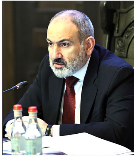
ՀՀ վարչապետ Նիկոլ Փաշինեան

«Հայկական կողմը դեռեւս ամիսներ առաջ Ատրպէյճանին է փոխանցել սահմանագատման եւ սահմանային անվտանգութեան հարցերով հետագայ աշխատանքների հետ կապուած իր առաջարկները, սակայն մինչ օրս պատասխան չենք ստացել: ՀՀ-ն Ատրպէյճանին է փոխանցել տարածաշրջանային հաճախակցութիւնների վերաբացման վերաբերեալ իր առաջարկները եւ պատրաստ է այդ ճանապարհով գնալ հարցի այսպաղ լուծման: Այդ առաջարկները ներառում են նաեւ ՀՀ բռնագրաւուած տարածքների խնդրի լուծումը: Մեր դիրքորոշումը շարունակում է մնալ նոյնը՝ Ատրպէյճանը պէտք է դադարեցնի ՀՀ ինքնիշխան տարածքների բռնագրաւումը, եւ նրա զօրքերը պէտք է հետքաշուեն ՀՀ ինքնիշխան տարածքից», ընդգծեց վարչապետը: Կառավարութեան հերթական նիստին վարչապետ Նիկոլ Փաշինե-