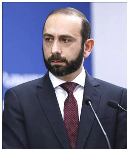
ՀՀ արտաքին գործերու նախարար Արարատ Միրզոյեան

Նախարար Արարատ Միրզոյեան ընդունած է Արցախի պատուիրակութիւնը՝ արտաքին գործերու նախարարի պաշտօնակատար Դաւիթ Բաբայեանի գլխաւոր-