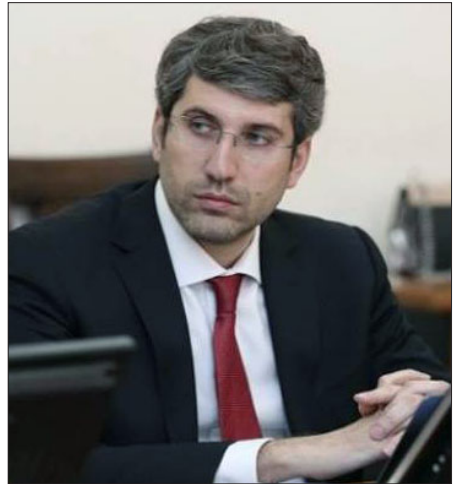
Արդարադատութեան նախարար Գրիգոր Մինասեան

Մինասեանը, որ արդարադատութեան նախարարի տեղակալն էր, պաշտօնէն ազատուեցաւ վարչապետին որոշմամբ: