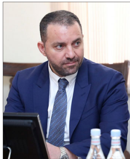
Տնտեսութեան նախարար Վահան Քերոբեան

2022 թվականի Նոյեմբերին հարկման հիմք ունեցող աշխատողներուն թիւը առաջին անգամ գերազանցած է 700 հազարը եւ կազմած է 701.451 մարդ՝ գերազանցելով անցած տարուան նոյն ամսուան ցուցանիշը 47.551-ով: Այս մասին յայտնած է տնտեսութեան նախարարը: