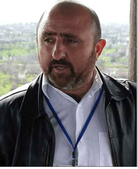
Յայտնի Լրագրող Թաթուլ Յակոբեան

Հանդիպում-քննարկումներու ընթացքին Թաթուլ Յակոբեան պիտի անդրադառնայ Հայաստան-Ատրպէյճան սահմանին տիրող իրավիճակին, Սիւնիքի եւ Արցախի մէջ ստեղծուած նոր պայմաններուն՝ 44-օրեայ պատերազմին յե-