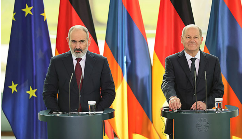
Գերմանիոյ եւ Հայաստանի վարչապետները միատեղ մամուլի ասուլիսի ընթացքին

Գերմանիան մտահոգուած է Հայաստանի եւ Ատրպէյճանի սահմանին անկայուն եւ ԼՂ-ի մէջ երթալով սրող մարդասիրական իրավիճակով: Գերմանիան կը կարեւորէ խաղաղ հանգուցալուծման հասնիլը՝ Հայաստանի եւ Ատրպէյճանի տարածքային ամբողջականութեան, ինչպէս նաեւ ԼՂ-ի քաղաքացիներու ինքնորոշման իրաւունքի տեսանկիւնէն: