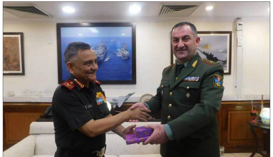
Զօրավար Էտուարտ Ասրեան Նիլ Տելիիի մէջ հանդիպում կ'ունենայ Հնդկաստանի պաշտպանութեան շտաբի պետին հետ

Հայաստանի Զինուած Ուժերու գլխաւոր շտաբի պետ, պաշտպանութեան նախարարի առաջին տեղակալ, զօրավար Էտուարտ Ասրեան Նիլ Տելիիի մէջ Հնդկաստանի պաշտպանութեան շտաբի պետ, զօրավար Անիլ Չաուհանի հետ քննարկած է երկկողմ համագործակցութեան եւ տարածաշրջանային անվտանգութեան հարցեր, այդ շարքին՝ պաշտպանութեան ոլորտին մէջ Հայաստանի եւ Հնդկաստանի համագործակցութեան ընդլայնման հնարաւորութիւնները: