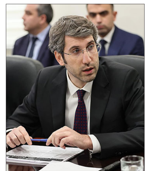
ՀՀ արդարադատութեան նախարար Գրիգոր Մինասեան

Հայաստանի մէջ սահմանադրական բարեփոխումներու համար ստեղծուած Սահմանադրական Բարեփոխումներու Խորհուրդը որոշում կայացուցած է այս պահին պահպանել պետութեան կառավարման ձեւաչափը, իսկ վարչապետի, գործադիր իշխանութեան եւ այլ մարմիններու լիազօրութիւններու շրջանակի յատկացման հարցը կը նախատեսէ քննարկել Մարտի վերջը: Այս մասին ըսաւ ՀՀ արդարադատութեան նախարար Գրիգոր Մինասեանը կառավարութեան նիստէն յետոյ լրագրողներու հետ ձեպագրուցին: Նախարարը ըսաւ, որ սահմանադրական բարեփոխումներու գործընթացը կ'ընթանայ բնական կշռոյթով: Կ'իրականացուին նաեւ հանրային քննարկումներ: «Արդէն հայեցակարգային որոշ դրոյթներ ուրուագծուել են, դա «նախագահ»-ի գլխին վերաբերելի դրոյթներ են: Պետութեան կառավարման ձեւի պահպանման ու լաւարկման որոշում է կայացուել Խորհրդի կողմից: Այս փուլում ձեւաւորում ենք նոր յանձնաժողով: Նախկին յանձնաժողովը համապատասխան ժամկետում իրա-