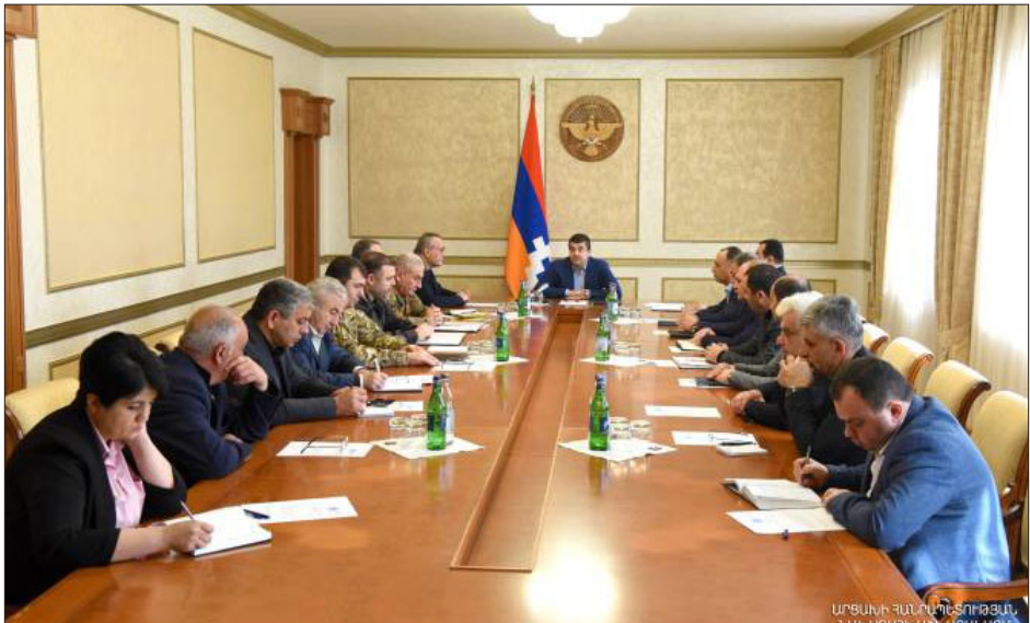
Արցախի նախագահ Արայիկ Յարութիւնեան կը գլխաւորէ Անվտանգութեան խորհուրդի նիստը

«Ատրպէյճանի ներկայացուցիչը փորձել է քննարկել քաղաքական թեմաներ՝ օգտագործելով հա-