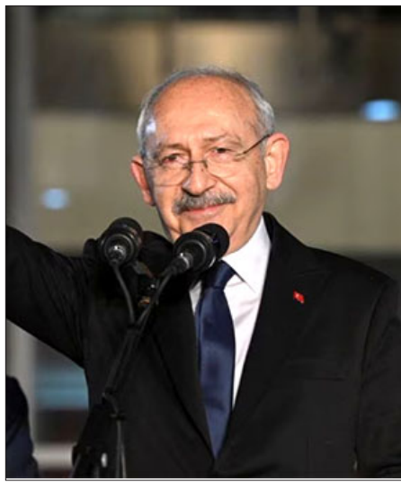
Թրքական ընդդիմութեան միասնական թեկնածու՝ Քեմալ Քըլըճտարօղլու

Ատրպէյճանը կը ձգտի Արցախի մէջ ցեղային գոտիներ իրա-