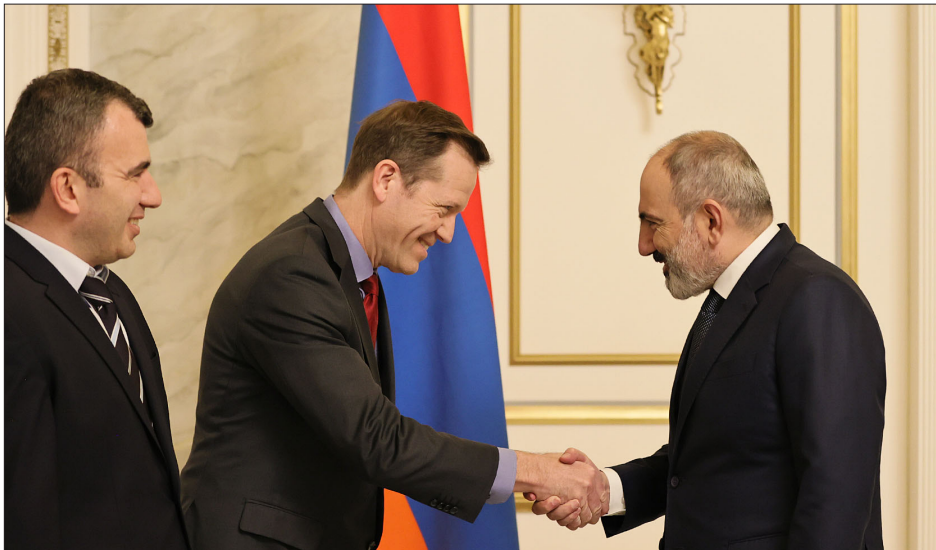
Վարչապետ Փաշինեան կ'ընդունի ամերիկեան Microchip Technology ընկերութեան փոխնախագահ Պրիւս Վեյերը

Հայաստանի Հանրապետութեան վարչապետ Նիկոլ Փաշինեան ընդունած է ամերիկեան Microchip Technology ընկերութեան փոխնախագահ Պրիւս Վեյերը եւ անոր գլխաւորած պատուիրակութիւնը: Վարչապետը ողջունած է Microchip Technology-ի մուտքը Հայաստան եւ հայկական Instigate Semiconductor ընկերութեան հետ համագործակցութիւնը, որու ծիրին մէջ Microchip Technology-ն մասնաճիւղ պիտի բանայ Հայաստանի մէջ: Նիկոլ Փաշինեան նշած է, որ տեղեկատուական արհեստագիտութեան բնագաւառի զարգացումը ՀՀ կառավարութեան առաջնահերթութիւններէն է, եւ ռազմավարական այս ոլորտին մէջ շարունակաբար կայուն աճ կ'արձանագրուի: «Մենք կարեւորում ենք հեղինակաւոր տեղեկատուական արհեստագիտութեան ընկերութիւնները ներգրաւուածը հայաստանեան շուկայ եւ պատրաստակամ ենք աջակցել ներդրումային գործընթացին, ինչը կը խթանի նորարարութիւնները աճը մեր տնտեսութիւնում», ըսած է վարչապետը եւ յիշատակած «էնթերփրայզ Արմէնիա» ներդրումներու աջակցման կեդրոնի գործունէութիւնը՝ ընդգծելով, որ կառուցելու կողմէ ներդրողներուն հետ կ'իրականաց-