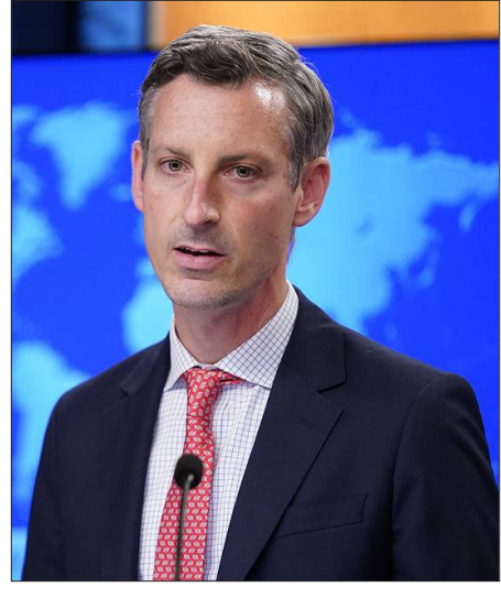
ԱՄՆ Պետական Քարտուղարութեան մամուլի քարտուղար Նետ Փրայս

«Մենք այդ կ'ընենք ոչ թէ Մոսկուայի հետ մրցակցելու համար, այլ երկու երկիրներուն միջեւ երկարատեւ հակամարտութիւնը, որ, ցաւօք, կը շարունակէ մարդկային կեանքեր խլել՝ ինչպէս Մարտ 5-ին, լուծելու եւ համաձայնութեան հասնելու նպատակով: Այստեղ մեզ կը հետաքրքրեն միայն խաղաղութիւնն ու անվտանգութիւնը, եւ այդ կը բխի Հայաստանի եւ Ատրպէյճանի