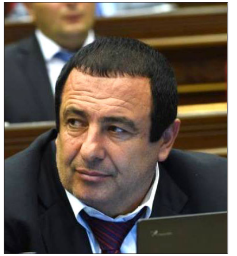
«Բարգաւաճ Հայաստան» կուսակցութեան նախագահ Գազիկ Ծառուկեան

Քրէական գործը յարուցուած էր 2020 թուականի Յունիսին: Այդ ժամանակ Գազիկ Ծառուկեանը ԱԺ պատգամաւոր էր, Ծառուկեանին անձեռնմխելութեան զրկելու եւ անոր նկատմամբ քրէական հե-