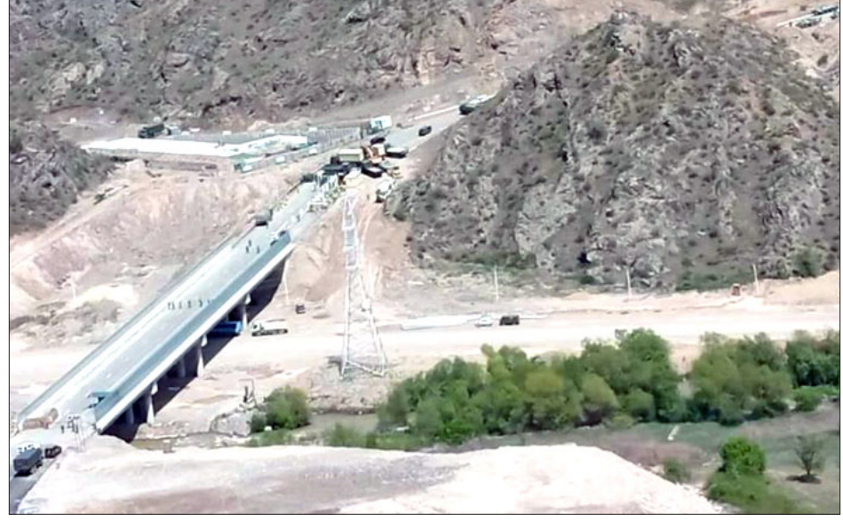
Դէպի Ստեփանակերտ տանող Հակարիի կամուրջին վրայ Ատրպէյճանի կողմէ հաստատուած անցակէտ

Ռուսական խաղաղապահ զօրակազմի հրամանատար, զօրավար-մայոր Անտրէյ Վոլքովի մասնակցութեամբ կը շարունակուին Հակարիի կամուրջը բանալու շուրջ բանակցութիւնները: Ռուսները առանձին քննարկումներ կը կատարեն ե՛ւ ատրպէյճանական, ե՛ւ արցախեան կողմերուն հետ, «Ազատութեան» հետ գրոցին տեղեկացուց Արցախի խորհրդարանի իշխող խմբակցութեան ղեկավար Արթուր Յարութիւնեանը: