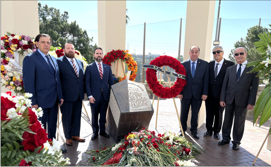
Տարբեր միջոցառումներով նշուեցաւ Հայոց Ցեղասպանութեան 108 ամեակը՝ Լոս Անճելըսի եւ շրջակայ քաղաքներուն մէջ: