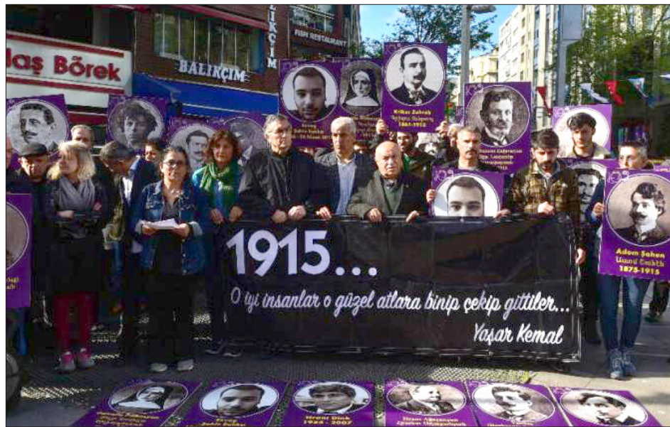
«Կանաչներու Չախ» կուսակցութեան անդամները Պոլսոյ մէջ կը նշեն հայերու ցեղասպանութիւնը, Յեղասպանութեան օրը

Թուրքիոյ մէջ գործող «Կանաչներու Չախ» կուսակցութեան անդամները Սթամպուլի Գուրթուլու թաղամասին մէջ (հին անուանումը Թաթալա), ուրկէ 108 տարի առջ սկսած է հայերու ցեղասպանութիւնը, Յեղասպանութեան օրուան նուիրուած յիշատակի միջոցառում ունեցած են: Այս մասին կը յայտնէ sendika.org-ը: