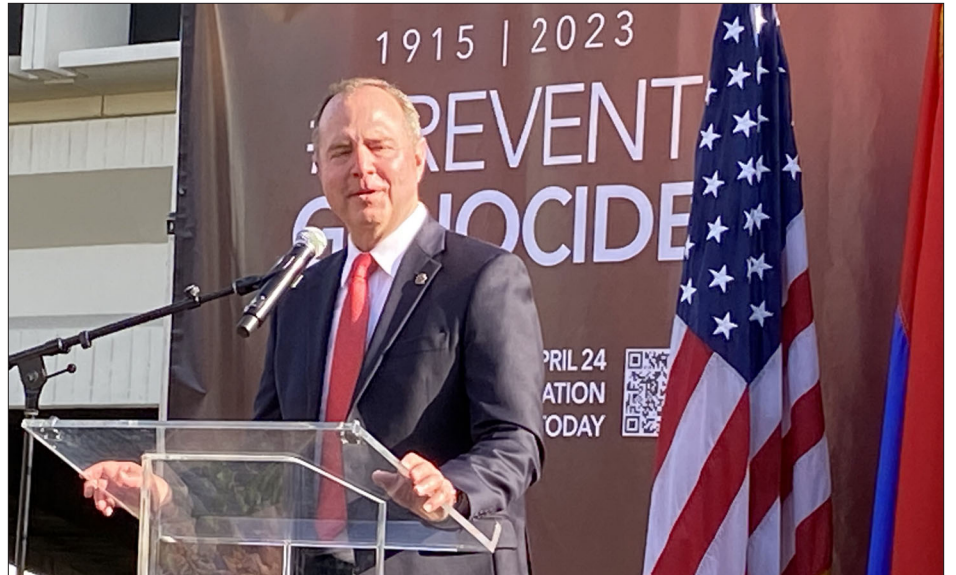
Կլէմտէի մէջ տեղի ունեցած հանրահաւաքի ընթացքին ելոյթ կ'ունենայ գոնկրէսական Ատան Շիֆ

ՀՀ նախագահ Վահագն Խաչատուրեան, վարչապետ Նիկոլ Փաշինեան, Ազգային Ժողովի նախագահ Ալէն Սիմոնեան, բարձրաստիճան այլ