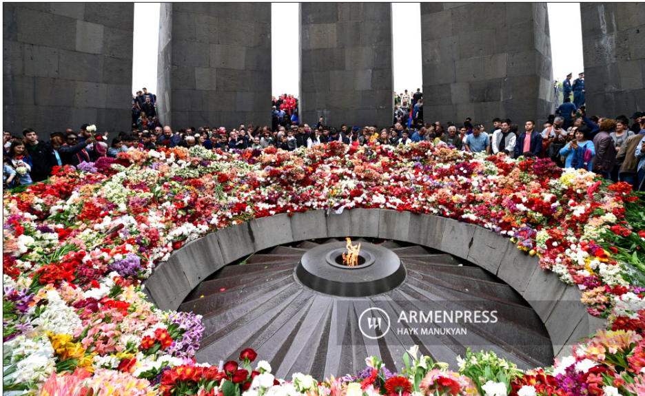
Երեւանի մէջ բազմահազար ժողովուրդ կ'այցելէ Ծիծեռնակաբերդի յուշահամալիր

Ապրիլ 24-ին, Հայու թիւնը նշեց Հայոց Ցեղասպանութեան 108-ամեակը անգամ մը եւս յիշեցնելով իր պահանջատիրութեան մասին: Աշխարհի տարբեր մայրաքաղաքներուն մէջ նախագահներ, վարչապետներ, խորհրդարաններու անդամներ եւ այլ բարձրաստիճան պաշտօնեաներ հանդէս եկան յայտարարութիւններով՝ դատապարտելով Հայ ժողովուրդի դէմ կատարուած անարդարութիւնը: