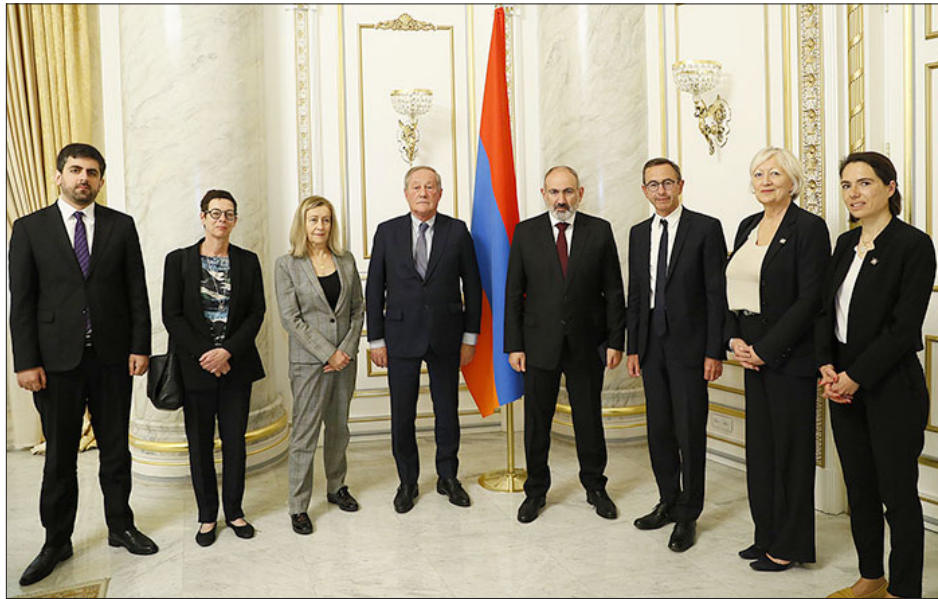
Նիկոլ Փաշինեան Ֆրանսացի Ծերակոյտականերուն հետ հանդիպումի ընթացքին

Հայաստանի Հանրապետութեան վարչապետ Նիկոլ Փաշինեան ընդունած է Ֆրանսայի Ծերակոյտին մէջ մեծամասնութիւն կազմող «Հանրապետականներ» խմբակցութեան նախագահ, Ծերակոյտին մէջ Լեւոնային Ղարաբաղի հարցով խումբի հիմնադիր եւ նախագահ, Արեւելքի քրիստոնեաներու հարցով կապի խումբի նախագահ Պրուևո Ռեթայօյի գլխավորած պատուիրակութիւնը: