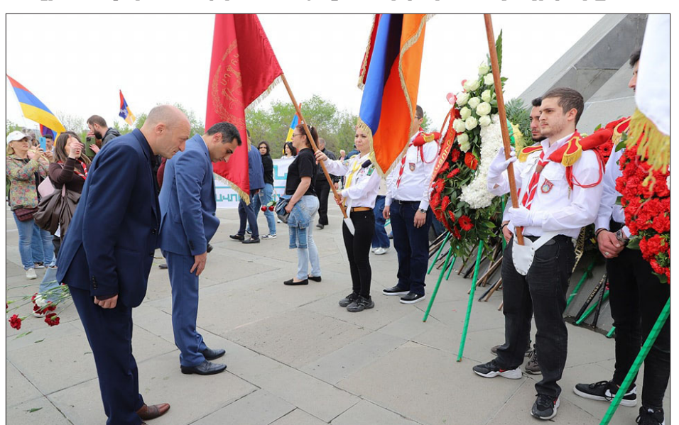
ՍԴՀԿ պատուիրակութիւնը Ծիծեռնակաբերդի Ցուշահամալիրին մօտ

Այսօր եկեք թարմացնենք այս խոստումը: Եկեք կրկին պարտաւորուինք դէմ արտայայտուելու ատելութեան, պաշտպանելու մարդու իրաւունքները եւ կանխելու վայրագութիւնները: Եւ միասին եկեք կրկնապատկենք մեր ջանքերը՝ կերտելու աւելի լաւ ապագայ, ուր բոլոր մարդիկ կրնան ապրիլ արժանապատուութեամբ, ապահով եւ յարգանքով», նշած է Ծո Պայտընը: