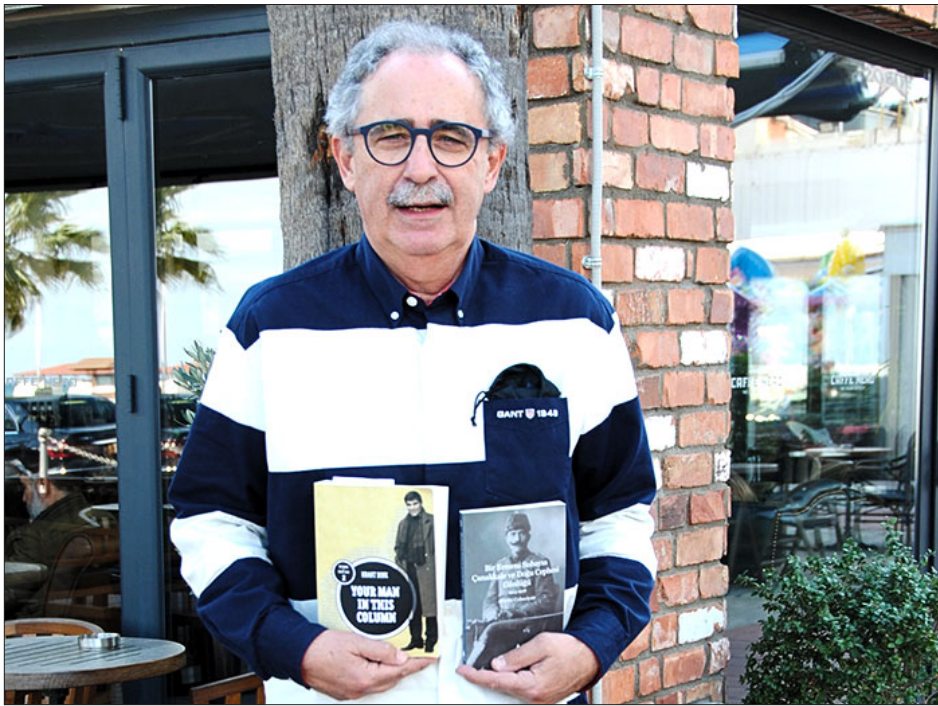
«Ցեղասպանութիւնը հայուն համար դարձաւ ինքնութեան հաւատարմութեան պահպանումը»: Փրոֆ. Ռիչըրտ Յովհաննիսեան