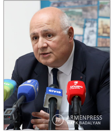
Յեղասպանութեան թանգարան-հիմնարկի տնօրէն Յարութեան

Ներկայիս աշխատանքներ կը տարուին նաեւ աւագ դպրոցի աշակերտներուն եւ ուսանողներուն համար Հայոց Յեղասպանութեան պատմութեան ուսումնասիրութեան դասընթացի ներդրման ուղղութեամբ: Անցեալ տարի այս թեմայով կայացած է «Հայոց Յեղասպանութեան թե-