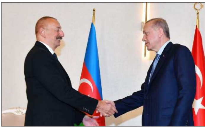
Իլհամ Ալիեւ եւ Ռեճեպ Էրտողան Պաքուի հետ մէջ կայացած հանդիպումի ընթացքին

Ատրպէյճանի առաջնորդը շեշտած է, որ Ռեճեպ Էրտողանի հետ քննարկած են նաեւ «Ձանգեզուր-