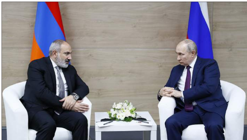
Նիկոլ Փաշինեան Սոչիի մէջ հանդիպում կ'ունենայ Ռուսաստանի նախագահ Վլատիմիր Փութինի հետ

Վարչապետ Նիկոլ Փաշինեան Սոչիի մէջ հանդիպում ունեցած է Ռուսաստանի նախագահ Վլատիմիր Փութինի հետ: