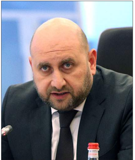
Հայաստանի կեդրոնական Դրամատան նախագահ Մարտին Գալստեան

«Տնտեսական աճի դանդաղ կշռոյթները Հայաստանում եւ գործընկեր երկրներում պահպանում են 2023 թ. երկրորդ եռամսեակում, եւ 12-ամսեայ գնաճի նուազումը շարունակում է պահպանուել, սակայն կոշտ գներով աչքի ընկնող ապրանքների եւ ծառայութիւնների գները դեռ շարունակում են պահպանուել բարձր մակարդակներում: Ուստի գործընկեր երկրների կեդրոնական դրամատուները կը շարունակեն վարել զսպող դրամավարկային քաղաքականութիւն», աւելցուց Կեդրոնական Դրամատան