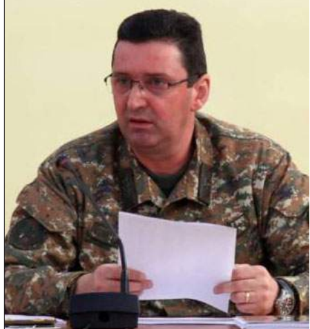
Արցախի պաշտպանութեան նախկին նախարար Ճալալ Յարութիւնեան

Դատախազը բաւարարած է Քննչական կոմիտէին միջնորդութիւնը՝ Արցախի պաշտպանութեան նախկին նախարար Ճալալ Յարութիւնեանի նկատմամբ յարուցուած հանրային քրեական հետապնդումը ժամանակաւորապէս կասեցնելու վերաբերեալ, յայտնեց ՔԿ խօսնակ Գոռ Աբրահամեանը: