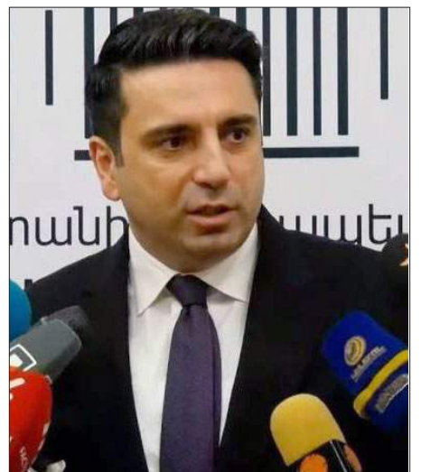
Աժ Նախագահ Ալէն Սիմոնեան

«Թուրքական կողմը, ցանկութիւն ունենալու պարագայում, կարող է անընդհատ պատճառներ բերել: Կարող է «Նեմեսիս»-ի արձանը չլինի, ուրիշ բան լինի: Ես ինքս «Նեմեսիս»-ի արձանի տեղադրումը սխալ եմ համարում, որովհետեւ դա պետական քաղաքականութեան գիծ չէ ու չի կարող լինել, բայց նորից եմ ասում, որ դա ընդամէնը առիթ էր Թուրքիայի համար: Ես ինքս յայտարարել եմ՝ Թուրքիա չզնալու համար կարող էի 1 միլիոն պատճառ գտնել ու չզնալ: Եթէ Թուրքիայի կողմից կամքը կայ, իսկ ես տպաւորութիւն ունեմ, որ կայ, ապա յարաբերութիւնները կարգաւորելու պատմական ու եզակի հնարաւորութիւն կայ, մենք դրան պատրաստ ենք, պատրաստ ենք նոյնիսկ անցնել մեծ քննադատութիւնների միջով, բայց երկա-