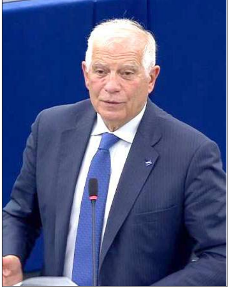
ԵՄ դիւանագիտութեան ղեկավար Ժողով Պորէլ

«Արդարադատութեան Դատարանը դատաւարած է Ատրպէյճանի կողմէ շրջափակումը, սակայն այս պետական անբեկչութիւնը չէ յանգեցուցած խորհուրդին կողմէ որեւէ պատժամիջոցի, իսկ Յանձնաժողովը, կը թուի, անկողմէ, ինչպէս հարկն է, դատաւարտել Լեռնային Ղարաբաղի ժողովուրդին հիմնարար իրաւունքներու այս շատ լուրջ խախտումը», նշած է ԵՄ պատգամաւորը: