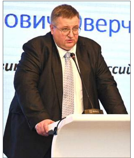
Ռուսիոյ փոխվարչապետ Ալեքսէյ Օվերչուք

Յունիս 2-ին Մոսկուայի մէջ տեղի ունեցած է տարածաշրջանին