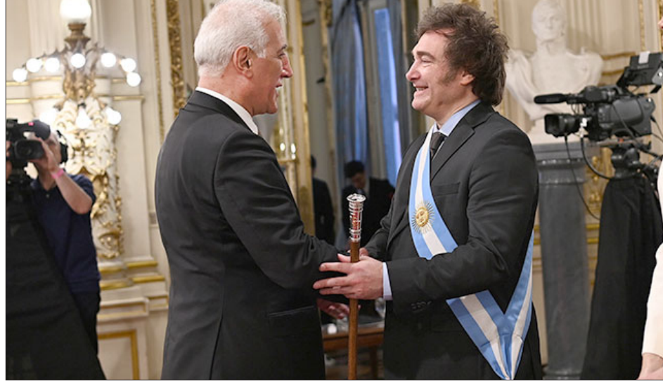
Արժանօրինակ նախագահ Խաչատուրեանը Վահագն Խաչատուրեանը

Խաչատուր Միլէյը հանդիսաւոր երդմամբ ստանձնած է Արժանօրինակ նախագահի պաշտօնը: Երդմանակալութեան արարողութիւնը տեղի ունեցած է մայրաքաղաք Պուենոս Այրեսի մէջ՝ Գոնկերէսի շէնքին մէջ: Այս առթիւ Պուենոս Այրէս ժամամած ՀՀ նախագահ Վահագն Խաչատուրեանը հանդիպած է Արժանօրինակ ընտրուած նախագահ Խաչատուր Միլէյի հետ: Ողջունելով նախագահ Խաչատուրեանը, Խաչատուր Միլէյը շնորհակալութիւն յայտնած է իր երդմանակալութեան արարողութեան մասնակցելու հրաւերը ընդունելու համար: «Ինձի համար պատիւ է հանդիպել Ձեզի, ես եղած եմ Հայաստան եւ ծանօթ եմ Հայաստանին, վստահ եմ, որ մենք աւելի կը խորացնենք ու սերտացնենք մեր յարաբերութիւնները», նշած է Արժանօրինակ ընտրուած նախագահը: Շնորհակալութիւն յայտնելով ջերմ ընդունելութեան համար, Վահագն Խաչատուրեանը շնորհաւորած է Խաչատուր Միլէյը՝ ընտրութիւններու