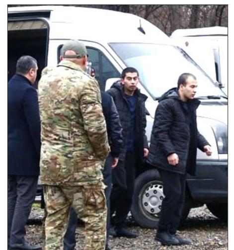
Գերիներու փոխանակում Հայաստանի Վերադարձան սահմանին

Դեկտեմբեր 13-ին, Հայ-ատրպէյճանական սահմանին վրայ տեղի ունեցաւ գերիներու փոխանակում: Ատրպէյճան Հայկական կողմին յանձնեց 32 Հայ զինուորներ, իսկ Հայաստան յանձնեց 2 ատրպէյճանցիներ: