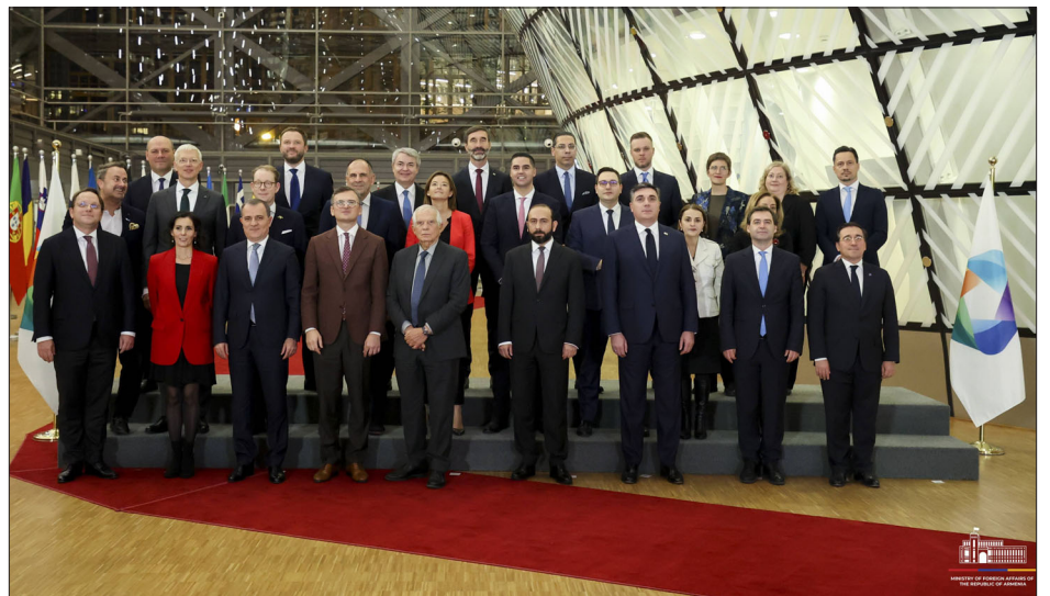
Պրիւքսէլի մէջ կայացած Արեւելեան գործընկերութեան նախարարական հանդիպման մասնակիցները

«Մեր վճռականութեան վերջին դրսեւորումը Հայաստանում Հռոմի կանոնադրութեան վաւերացումն էր: Միանալով Արդարադատութեան միջազգային դատարանին՝ Հայաստանն իր ներդրումը