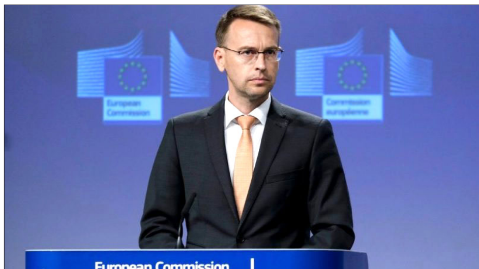
ԵՄ պաշտօնական ներկայացուցիչ Փիթըր Սքանօ

Եւրոմիութիւնը չի դիտարկեր Հայաստանի հետ համատեղ գործարարութիւններ անցնելու հնարաւորութիւնը, ըսած է ԵՄ արտաքին քաղաքականութեան ծառայութեան պաշտօնական ներկայացուցիչ Փիթըր Սքանօն: