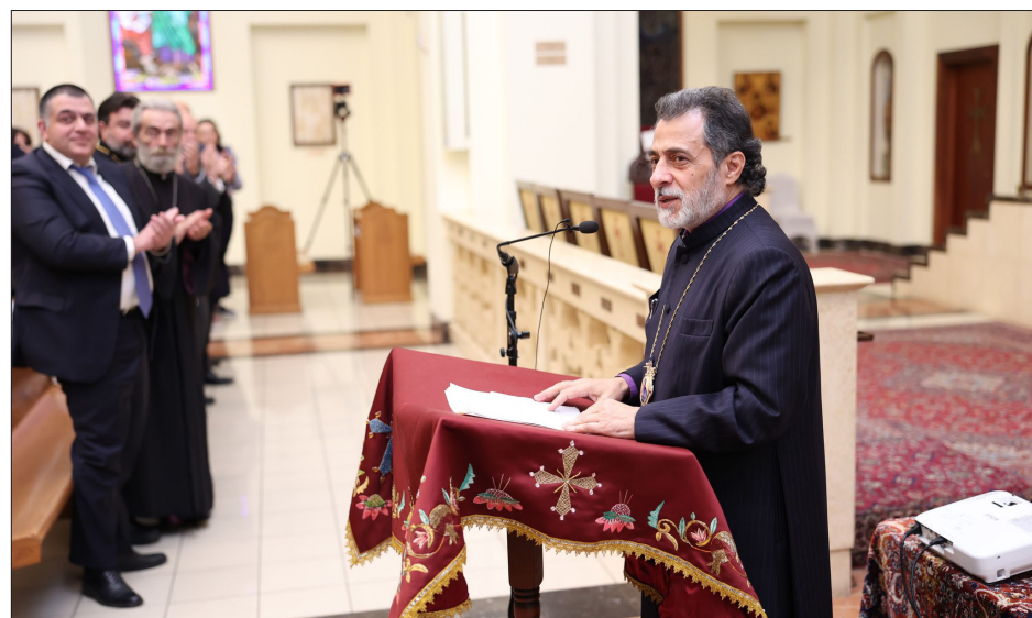
Ելոյթ կ'ունենայ Յովնան Արք. Տէրտէրեան

Անցեալ Կիրակի, Դեկտեմբեր 10-ին, 2023, տեղի ունեցաւ «Վերակերտումի Տասնամեակներ» խորագիրը կրող յիշատակելի տօնախմբութիւն մը, Պրոպէլէի Սրբոց Ղեկնողեանց Մայր տաճարին մէջ: Արդարեւ, բազմաճարտիչ հրաւիրեալներ ներկայ էին, միասնաբար ոգեկոչելու եւ տօնախմբելու Գերշ. Տ. Յովնան Արք. Տէրտէրեանի Արեւմտեան Թեմի առաջնորդութեան քսան ամեակը: Օրուան հիւրերու շարքին կը գտնուէին Արցախի նախկին առաջնորդ Գերշ. Պարգեւ Արք. Մարտիրոսեան, Գերշ. Յովնան Եպս. Յակոբեան (Ս. էջմիածին), Լուս Անճէլոսի մօտ Հայաստանի նոր աւագ հիւպատոս Կարէն Իսրայէլեան, նախկին աւագ հիւ-