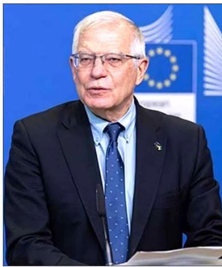
ԵՄ գերագոյն ներկայացուցիչ Ժոզեփ Գորչիլ

«Կարեւոր է շարունակել ուժադրութիւն դարձնել Արեւելեան