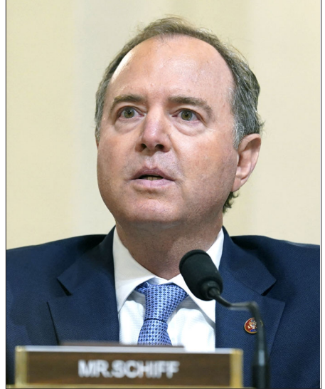
Գոնկրեսական Ատամ Շիֆ

«Արցախը արտաքին աշխարհի հետ կապող միակ ճանապարհի՝ Լազինի միջանցքի 10 ամիս տեւած շրջափակմամբ արցախցիներուն սովի ենթարկէ յետոյ, ատրպէյճանական ուժերը Սեպտեմբերի 19-ին լայնածաւալ յարձակում գործեցին