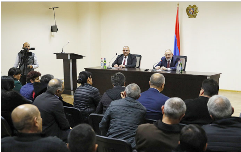
Վարչապետ Նիկոլ Փաշինեանի հանդիպումը Զայաստան վերադարձած շիրակցի գերիներու հարագատներուն հետ

Վարչապետ Նիկոլ Փաշինեան տրկնոջ՝ Աննա Յակոբեանի հետ հանդիպում ունեցած է անցած շաբաթ Զայաստան վերադարձած շիրակցի գերիներու հարագատներուն հետ: