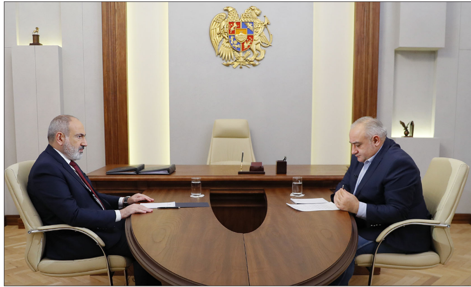
Վարչապետ Նիկոլ Փաշինեան Պետրոս Դազարեանի հետ հարցազրոյցի ընթացքին

Պատասխանելով հարցազրույցի Պետրոս Դազարեանի այն հարցին թէ, ինչո՞ւ ըսիք՝ նշաձող պէտք է իջեցնել, Փաշինեան պատասխանեց՝ «որովհետեւ մենք ուզում