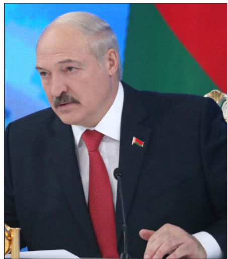
Պելառուսիոյ նախագահ Ալեքսանտր Լուքաշենքոն

«Եթէ երթային անոր, չէր ըլլար առիթ սանձազերծելու այս պատերազմը: Ամէն ինչի շուրջ կը պայմանաւորուէին: Ինչո՞ւ այդ ժամանակ չըրին: Չըրին՝ ստացան: Ի՞նչ է, Հայաստանի համար աւելի