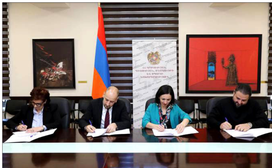
ԿԳՄՍ նախարարութեան եւ Գերմանացի ֆիլմ արտադրող Թիւ Շվայկերի ներկայացուցչին միջեւ կը ստորագրուի համաձայնագիր

Հայաստանի մէջ NETFLIX-ի համար ֆիլմեր ու հաղորդաչարեր պիտի նկարահանուին: Այս մասին Ֆէյսպուքի իր էջով գրած է Հայաստանի Ազգային Ժողովը «Քաղաքացիական Պայմանագիր» խմբակցութեան պատգամաւոր Սիսակ Գաբրիէլեանը: «Ինչպէս եւ ակնկալում էի, Ֆիլմի օրէնքում վերջերս կատարուած փոփոխութիւնները գրաւիչ են դարձնում Հայաստանը ֆիլմարտադրութեան համար: Գերմանացի յայտնի դերասան, ֆիլմի արտադրող Թիւ Շվայկերի ներկայացուցչի հետ այսօր ԿԳՄՍ նախարարութիւնում ստորագրեցինք համագործակցութեան յուշագիր: Ընդհանուր երեք ֆիլմ, «Underdog», «Dead by Dawn», «Collapse» (Նեթֆլիքսի 8 մասնոց ֆիլմ), որոնք կը նկարահանուեն Հայաստանում: Նկարահանումները նախատեսուած են սկսել տարեսկզբին: