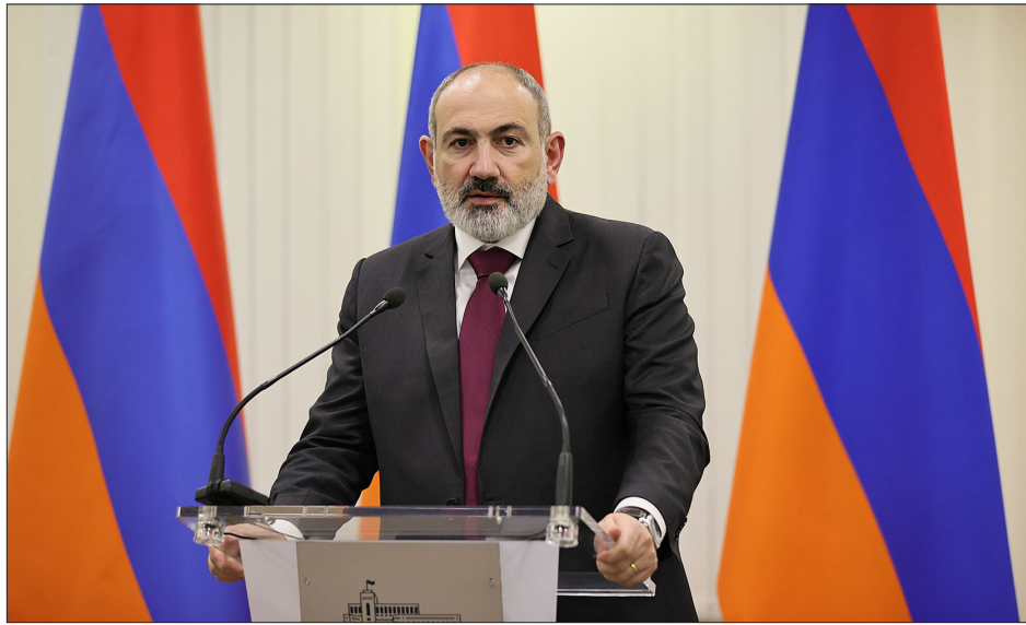
Փաշինեան ելոյթ կ'ունենայ Արտաքին գործերու նախարարութեան մէջ Ամանորի եւ Սուրբ Ծննդեան առթիւ կազմակերպուած ընդունելութեան ժամանակ

Հայաստանի կառավարութեան առաջնահերթութիւններու շարքին է տարածաշրջանային յարաբերութիւններու բարելաւումը եւ կարգաւորումը, Արտաքին գործերու նախարարութեան մէջ Ամանորի եւ Սուրբ Ծննդեան առթիւ կազմակերպուած ընդունելութեան ժամանակ յայտնած է վարչապետ Փաշինեանը: «Շարունակում ենք հատարել մշակ խաղաղութեան օրակարգին արդէն իսկ համաձայնեցուած երեք սկզբունքներ շրջանակներում: Յոյս ունենք, որ վերջին շրջանում տարածաշրջանում եւ տարածաշրջանի երկրներում տեղի ունեցող իրադարձութիւնները վերջնադրոշմով չեն վկայի այն մասին, որ տեղի է ունենում խաղաղութեան գործընթացի միտումնաւոր ձգտում», ըսած է ան: ԱԳՆ-ի մէջ հայաստանցի դիւանագետներէն բացի, նաեւ օտարերկրեայ դեսպանները եղած են: Վարչապետ Փաշինեան անոնց ներկայութեամբ խօսած է Հայաստանի ակնկալիքներէն ու դժգոհած է