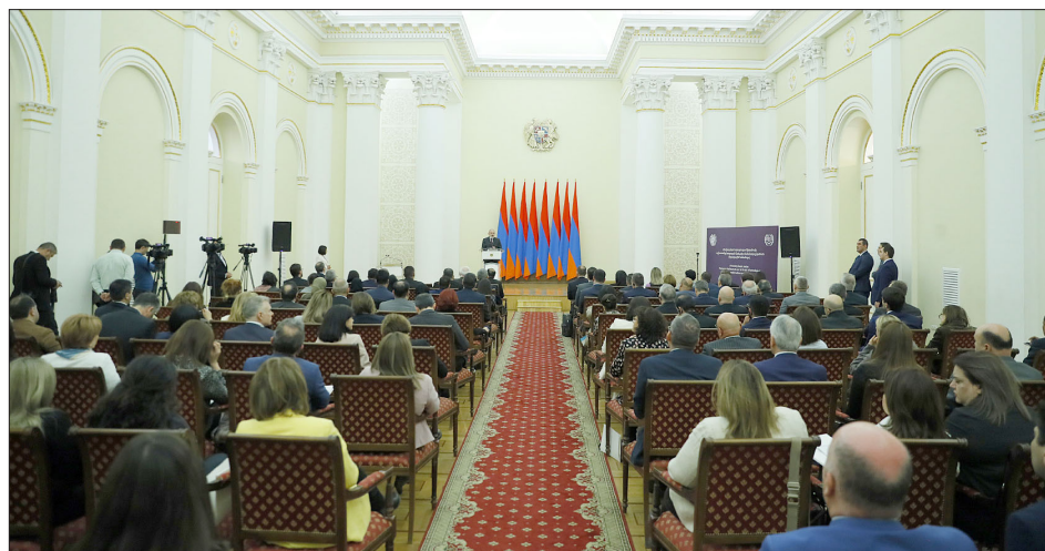
Աշխատանքի միջազգային համաժողովը Երեւանի մէջ

Չնայած Մարտահրաւէրներուն եւ Դժուարութիւններուն, Հայաստանի Մէջ Նկատելի Են Աշխատանքի Ոլորտին Մէջ Զարգացումները. Կիլլպերթ Եունկպօ Հայաստանի մէջ առաջին անգամ տեղի ունեցած է Աշխատանքի միջազգային համաժողով՝ Աշխատանքի եւ ընկերային հարցերու նախարարութեան նախաձեռնութեամբ եւ Աշխատանքի միջազգային կազմակերպութեան (ԱՄԿ) գլխաւոր տնօրէն Կիլլպերթ Եունկպօյի մասնակցութեամբ: