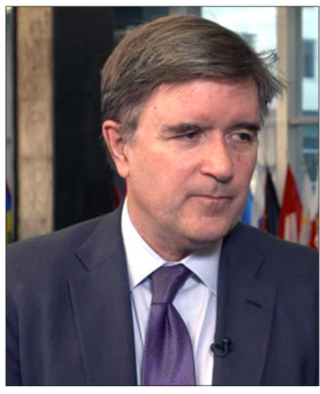
ԱՄՆ պետական քարտուղարին օգնական ձեռնարկը ՕՊրայըն

Մենք, ինչպէս նաեւ Եւրոմիութեան մեր գործընկերները եւ այլ կողմեր պատրաստ ենք օգնելու