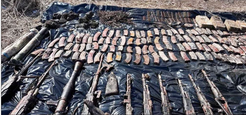
Յայտնաբերուած Զէնք-Ձինամթերքի մէկ մասը

Պաշտպանութեան նախարարութեան ռազմական ոստիկանութեան Կիւմրիի բաժինը քաղաքացիներու շրջանակին մէջ յայտնաբերած է գնդացիներ, նռնակահաններ, ինքնաձիգեր, փամփշտատուփեր եւ 3007 հատարներ տրամաչափի փամփուշտներ: