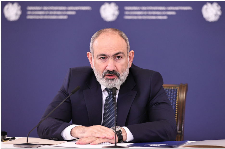
Վարչապետ Նիկոլ Փաշինեան մամլոյ ասուլիսի ընթացքին

Նոր Սահմանադրութեան վերաբերեալ բնագիր ու հայեցակարգ չկայ, իսկ ժամանակին համապատասխան յանձնաժողովի կողմէ ստեղծուած հայեցակարգը արդիական չէ: Այն քաղաքական օրակարգ է եւ խօսուած հանրութեան հետ թեմայի շուրջ խօսակցութիւն ունենալու նպատակով: Այս մասին ՀՀ վարչապետ Նիկոլ Փաշինեան ըստ մամլոյ ասուլիսին: