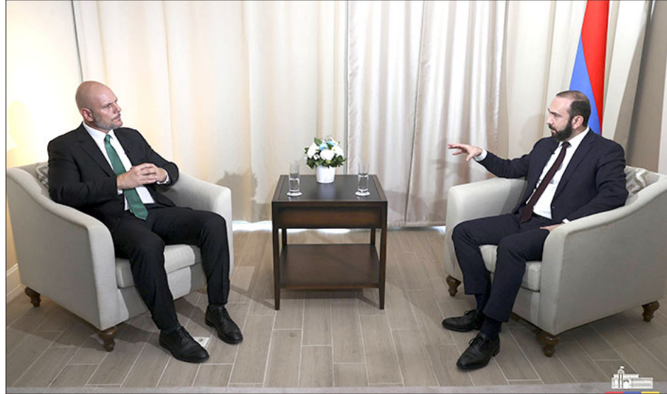
ՀՀ արտաքին գործերու նախարար Արարատ Սիրգոյեանի հարցազրոյցը թրքական «TRT World» հեռուստաընկերութեան

Միջազգային մամուլին մէջ լայն արձագանգ գտած է ՀՀ արտաքին գործերու նախարար Արարատ Սիրգոյեանի հարցազրոյցը թրքական «TRT World» հեռուստաընկերութեան, որուն մէջ ան, ի թիւս այլ հարցերու, անդրադարձած է Հայաստանի՝ Եւրոմիութեան անդամակցելու գաղափարի քննարկումներուն: