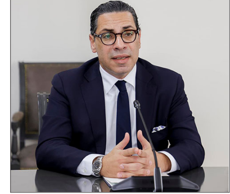
պիտի մօտեցնեն ԵՄ-ին», ըսած է նախարարը:

Կիպրոսը համակարգուած պիտի աշխատի ԵՄ-Հայաստան երկխօսութեան ամրապնդման ուղղութեամբ: Կիպրոսի արտաքին գործերու նախարար Կոնստանդինոս Գոմպոս այս մասին յայտարարած է ՀՀ արտաքին գործերու նախարար Արարատ Միրզոյեանի հետ համատեղ ասուլիսի ընթացքին: