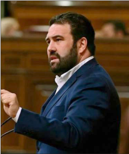
Սպանացի պատգամաւոր ճոն Ինյարիթու

Սպանացի պատգամաւոր ճոն Ինյարիթուն կը կարծէ, որ միջազգային հանրութիւնը պէտք է նպատակաւորաբար պատժամիջոցներ կամ այլ պատիժ սահմանէ այն անձներուն կամ կազմակերպութիւններուն նկատմամբ, որոնք պատասխանատու են Լեռնային Ղարաբաղի հայկական պատմանշակութային ժառանգութեան ոչնչացման եւ սպառնալից խախտումները կանխելու համար: