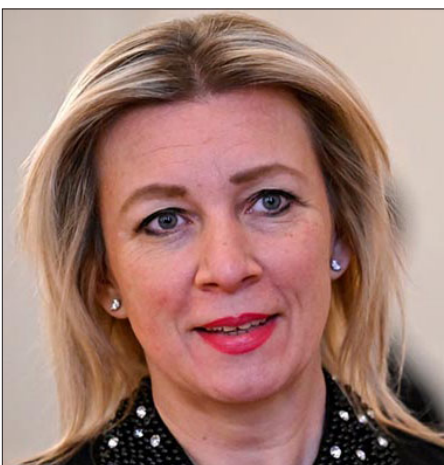
Ռուսաստանի Արտաքին գործերու նախարարութեան ներկայացուցիչ Մարիա Ջախարովա

Ափրիկեան քաղաքականութեան ձախողումէն յետոյ Ֆրանսան հիմա ալ կը փորձէ Լեռնային Ղարաբաղի մէջ խաղաղապահի դեր ստանձնել, թէեւ այստեղ Ռուսաստանը խաղաղապահ գործունէութիւն իրականացուցած է, յայտնած է Ռուսաստանի Արտաքին գործերու նախարարութեան պաշտօնական ներկայացուցիչ Մարիա Ջախարովան: