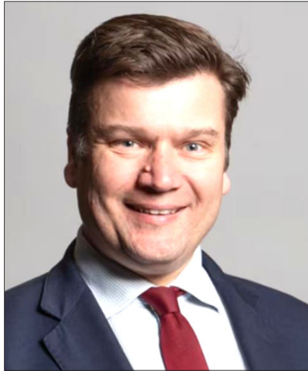
Միացեալ Թագաւորութեան գինուած ուժերու նախարար ձէյմս Հիփփի

«Միացեալ Թագաւորութիւնը ստորագրած է ԵԱՀԿ սպառնալիքներէն ներքին արգելքը, եւ, որպէս այդպիսին, Միացեալ Թագաւորութեան պաշտպանական արդիւնաբերութեան համար որեւէ օգուտ պէտք է իրականացուի մանստաթա-